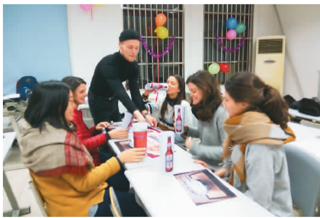
学生正通过情景对话学习汉语

紧接着上场的是一个国际小组，4名同学分别来自老挝、意大利、西班牙和埃及。他们的话题是“去朋友家做客”。先是埃及同学当“主持人”介绍“演员”，然后老挝同学和意大利同学在路上“偶遇”，商量一起“打的”去朋友家。“主持人”马上戴上道具变身“的哥”。到了