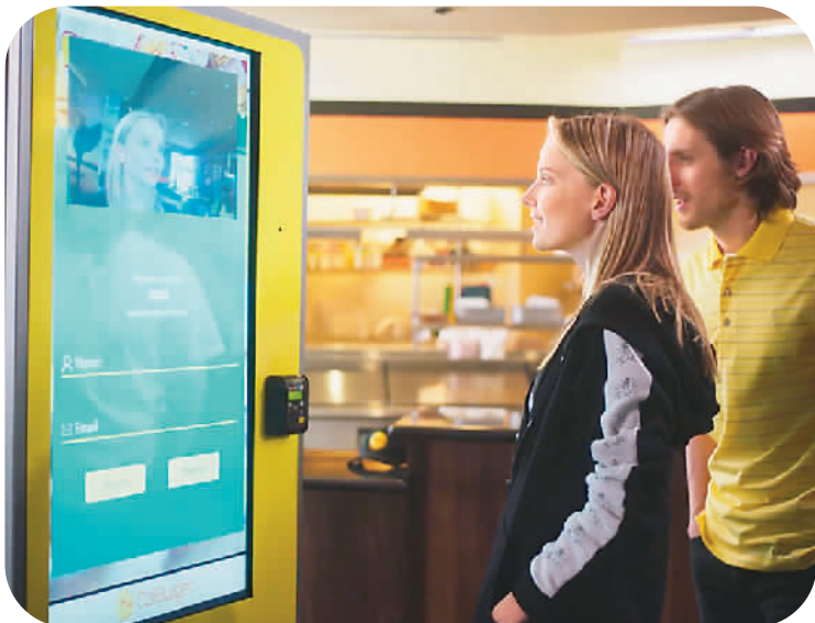
图为消费者正在使用人脸识别点单机购买汉堡。

随着准确率和速度的提升，人脸识别技术的应用场景将不断拓展。有关人士表示，该技术有望在闸道、安防等方面打开增量市场，有助于提高工作效率、巩固安保措施、遏制犯罪行为。