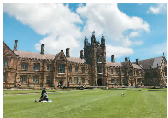
悉尼大学校园一角

2017年10月，我只身来到澳大利亚悉尼市，成为留学生大军中的一员。从最初的新鲜好奇到之后的孤独迷茫，再到后来的目标明确，在这短短的几个月里，我成长了，也有很多感悟。