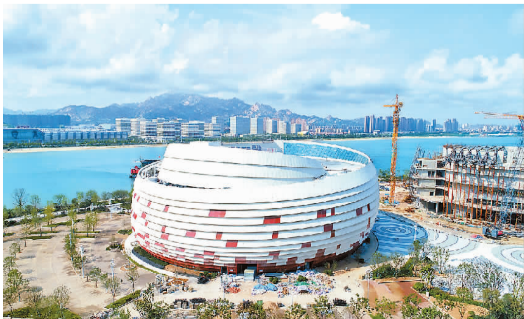
青岛东方影都大剧院将于本月正式交付使用，会给青岛市民带来前所未有的视听享受。