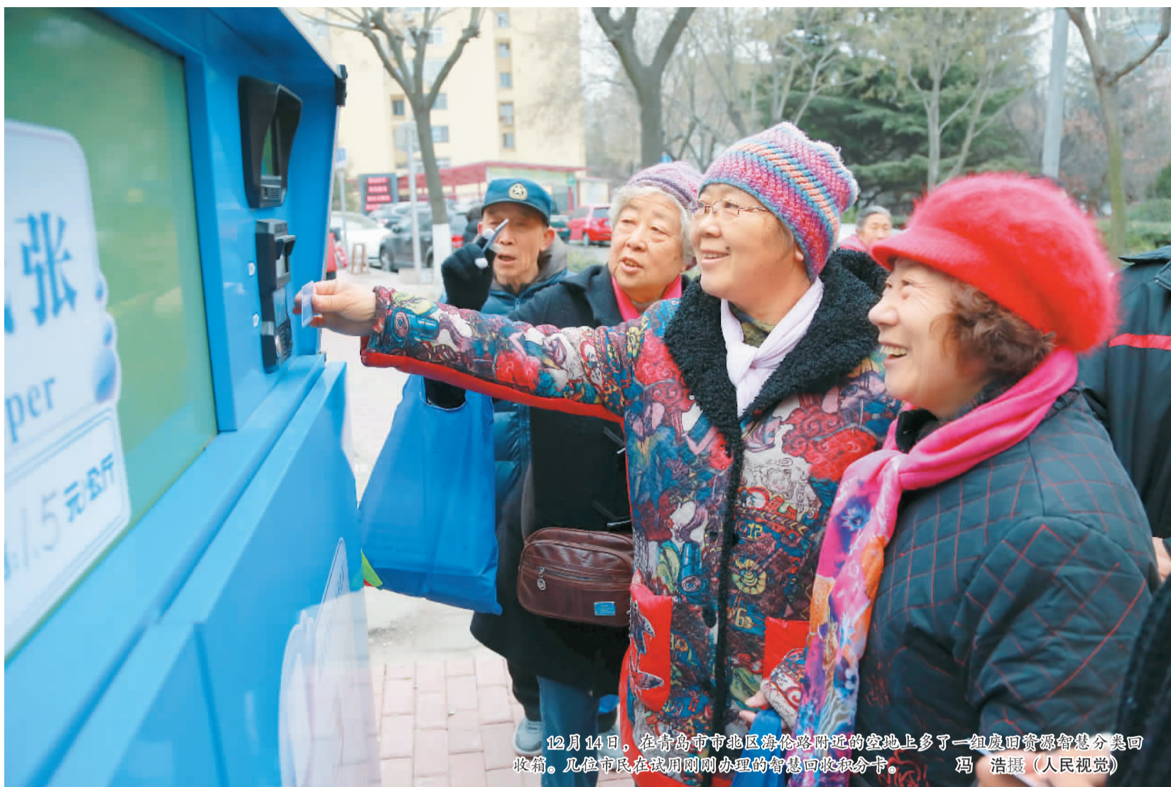
12月14日，在青岛市市北区海泊路附近的空地上多了一组废旧资源智慧分类回收箱。几位市民在试用刚刚办理的智慧回收积分卡。