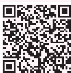
扫描二维码 回看视频

我们要应对新时期的新变化，严格遵守《文物保护法》，在前辈们的精神指引下，与时俱进地往前走。每个时代文物工作者、文化工作者都有不同的使命，我们今天面对的是一个更加需要奋斗的弘扬中华优秀传统文化的过程。