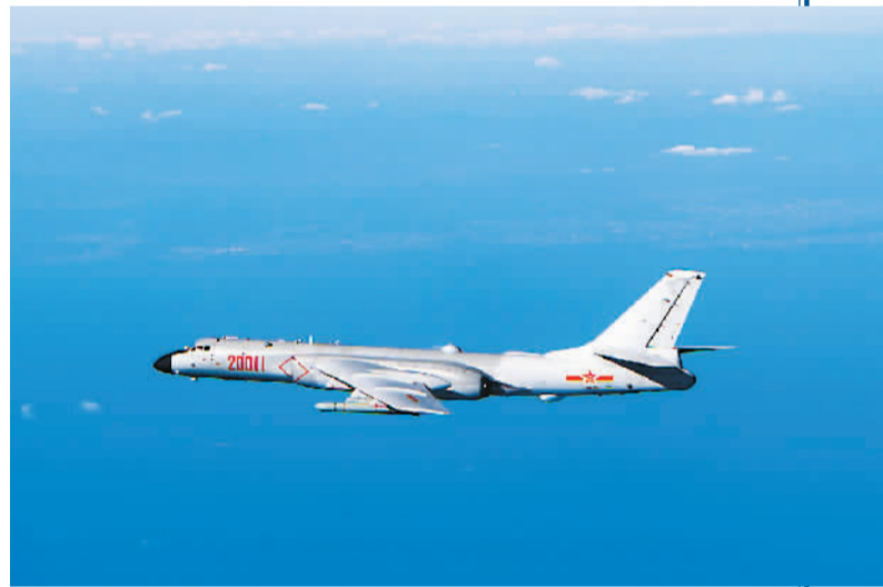
▲ 图为飞行途中的轰-6K战机。 ▲ 图为轰-6K战机从华东某机场起飞。