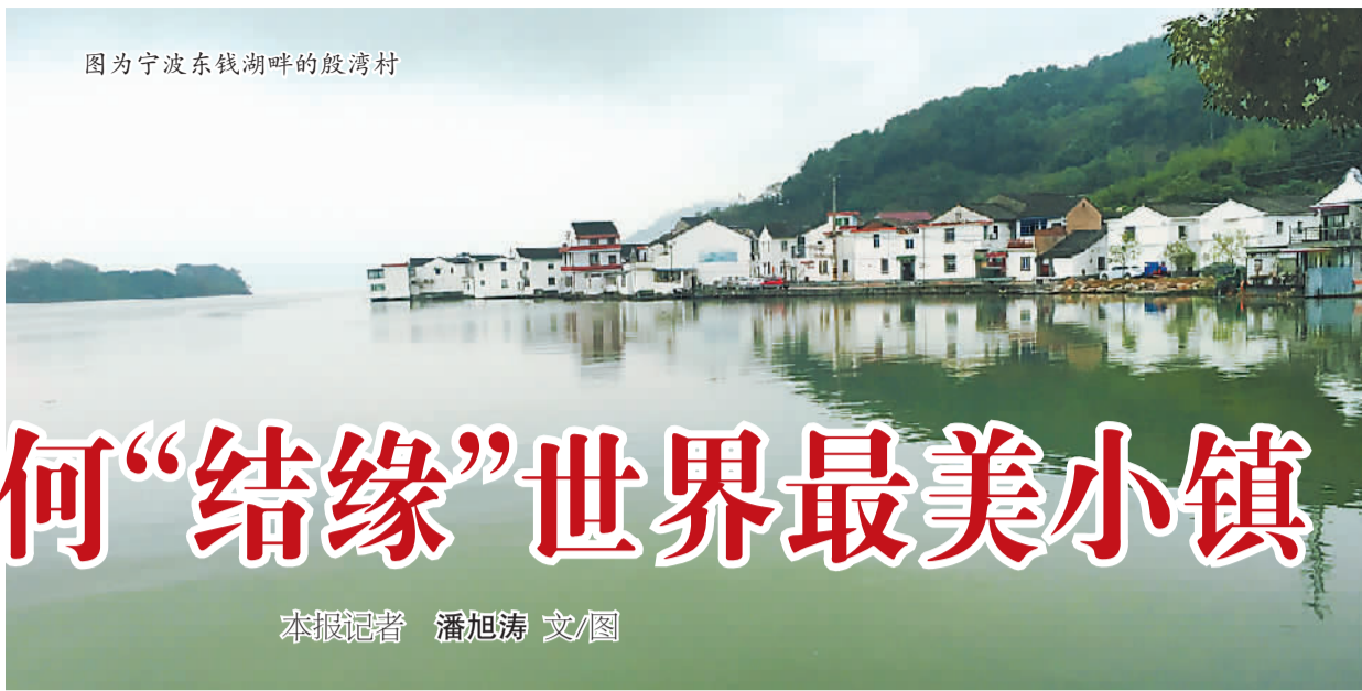
图为宁波东钱湖畔的殷湾村

最近,奥地利哈尔斯塔特湖区找到了一位东方“密友”。作为世界文化遗产,哈尔斯塔特素有“世界最美小镇”之称。11月22日,哈尔斯塔特湖区与中国东钱湖国家旅游度假区签约结成友好湖区。