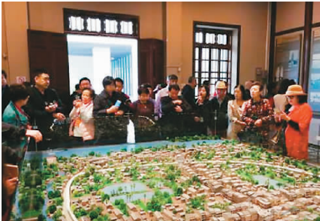
图为参加世界侨商海口峰会的侨商、侨领在海口市考察。

多位侨商对美丽特色小镇、医疗养生、生态旅游、光伏农业、养老服务等项目兴趣浓厚，正在与海口市有关单位进一步洽谈沟通。（来源：中国侨网）