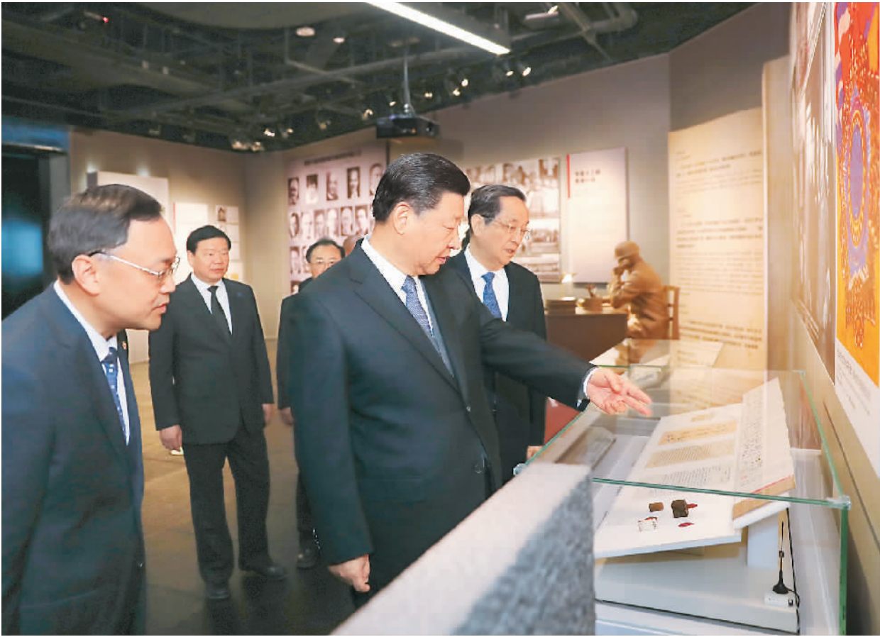
12月13日上午,中共中央、全国人大常委会、国务院、全国政协、中央军委在南京隆重举行南京大屠杀死难者国家公祭仪式,中共中央总书记、国家主席、中央军委主席习近平出席。图为习近平在广场仪式结束后参观《南京大屠杀史实展》。