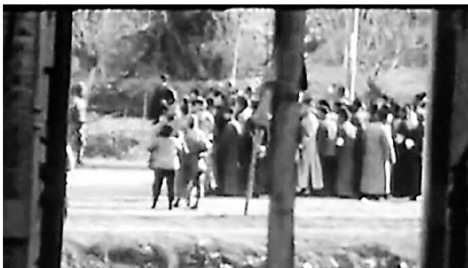
▲图为约翰·马吉当年拍摄的南京视频截图。

重拍“祖父路”就像一次生命的轮回。80年前的南京大屠杀是一场沉重的悲剧,使几十万人遭受灾难。经过多年发展,今天的南京已经从伤痛中恢复过来,重新变得繁华又充满欢乐。“这里适合旅游,也适合居住。我想让世界看到今日南京的美好,有实力雄厚的医院,有四通八达的高铁,有书声琅琅的校园……希望能通过马吉家族的照片连接过去与现实、中国与西方,让更多人了解南京大屠杀这段历史,也看到人们如何在战争中幸存,又如何重生,创造出一个美丽新世界。”克里斯·马吉说。“跨越80年的时空,这是南京今昔对比的最好历史资料,更是爱的延续。”侵华日军南京大屠杀遇难同胞纪念馆馆长张建军表示,待克里斯·马吉拍摄完成后,纪念馆计划于明年在国内外出版他的摄影集,并在馆内举办摄影作品展,通过其视角,让更多人了解南京大屠杀历史,了解南京这座城市。(据新华社南京12月12日电 记者蒋芳 邱冰清)