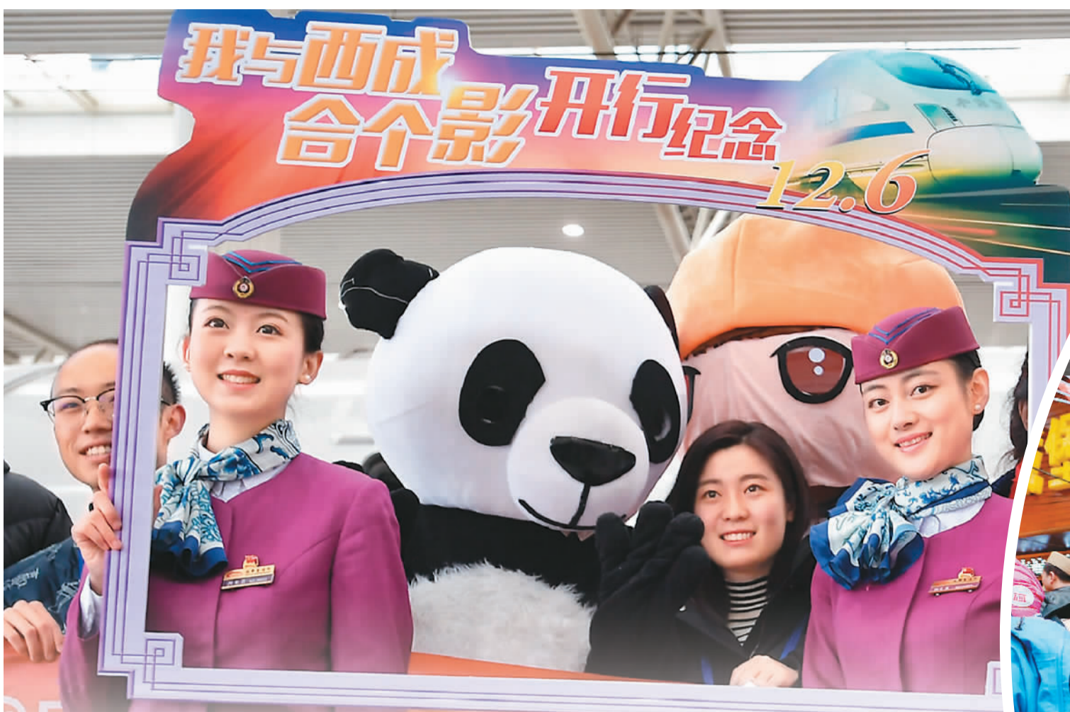
12月6日，在成都东站，乘客同乘务员和“熊猫”在西成高铁成都首发列车前合影。

12月6日，我国首条穿越秦岭的高铁——西（安）成（都）高铁全线正式开通运营。这条川陕人民期盼已久的客运专线，不仅串联起沿线地区的经济和社会进步，也打通了两省丰富的旅游资源。从秦腔到川剧，从兵马俑到武侯祠，从泡馍凉皮到火锅抄手，这些都随着西成高铁的开通变得“触手可及”。跟着高铁“逛吃逛吃”，将成为广大游客体验川陕两地的新选择。