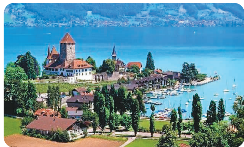
塞浦路斯海滨一景