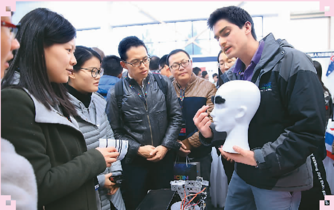
2017年11月25日，来自德国高校的参赛选手在2017年第十一届iCAN国际创新创业大赛暨全球创新创业大会上介绍修眉仪。