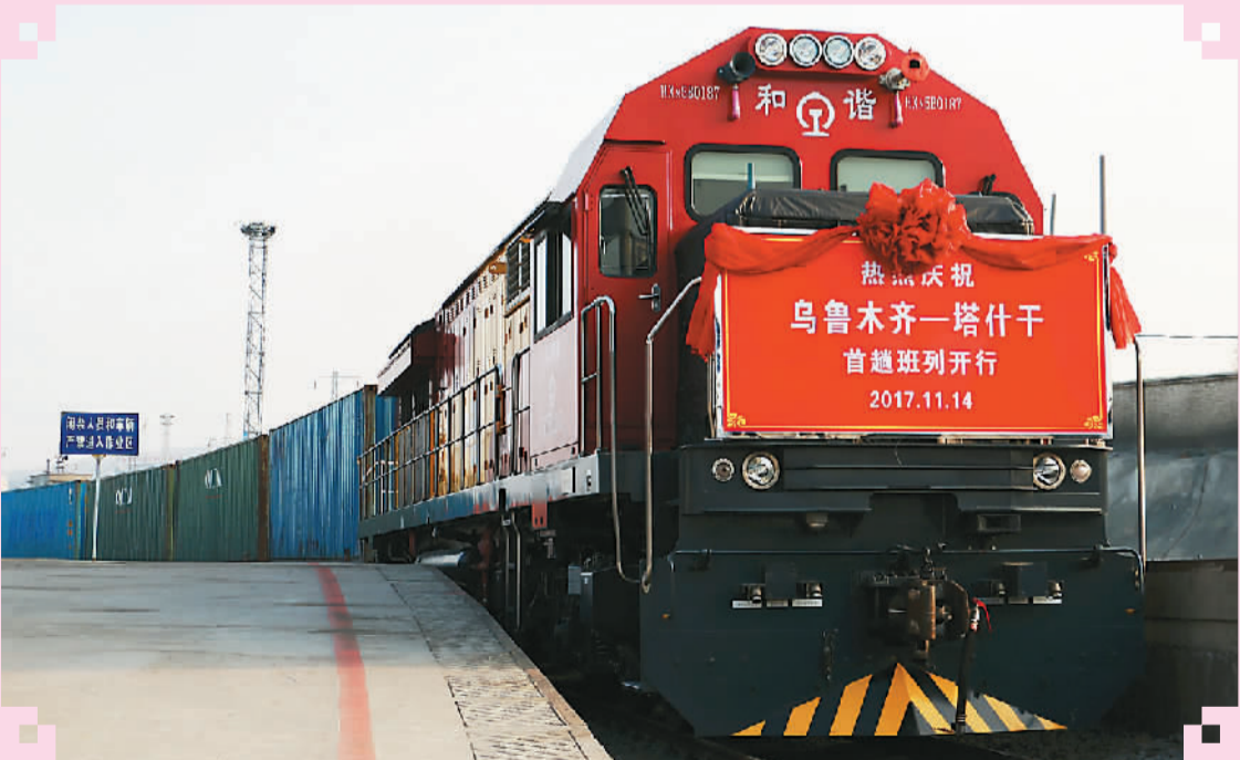
11月14日17时，首趟乌鲁木齐—塔什干“点对点”直达货运班列驶出中欧班列乌鲁木齐集结中心。

会诚信建设，增强国家意识、法治意识、社会责任意识，倡导科学精神，弘扬中华传统美德。推动经济建设和国防建设融合发展，坚持发展和安全兼顾、富国和强军统一，实施军民融合发展战略，形成全要素、多领域、高效益的军民深度融合发展格局。 绿色发展正在取得新突破。十九大报告指出，加快建立绿色生产和消费的法律制度和政策导向，建立健全绿色低碳循环发展的经济体系。构建市场导向的绿色技术创新体系，发展绿色金融，壮大节能环保产业、清洁生产产业、清洁能源产业。推进能源生产和消费革命，构建清洁低碳、安全高效的能源体系。推进资源全面节约和循环利用，实施国家节水行动，降低能耗、物耗，实现生产系统和生活系统循环链接。倡导简约适度、绿色低碳的生活方式，反对奢侈浪费和不合理消费，开展创建节约型机关、绿色家庭、绿色学校、绿色社区和绿色出行等行动。 中国正主动参与和推动经济全球化进程。十九大报告指出，要以“一带一路”建设为重点，坚持“引进来”和“走出去”并重，遵循共商共建共享原则，加强创新能力开放合作，形成陆海内外联动、东西双向互济的开放格局。拓展对外贸易，培育贸易新业态新模式，推进贸易强国建设。实行高水平的贸易和投资自由化便利化政策，全面实行准入前国民待遇加负面清单管理制度，大幅度放宽市场准入，扩大服务业对外开放，保护外商投资合法权益。凡是在我国境内注册的企业，都要一视同仁、平等对待。优化区域开放布局，加大西部开放力度。赋予自由贸易试验区更大改革自主权，探索建设自由贸易港。创新对外投资方式，促进国际产能合作，形成面向全球的贸易、投融资、生产、服务网络，加快培育国际经济合作和竞争新优势。 共享发展让人民群众有更多获得感。落实共享发展理念，归结起来就是两个层面的事。一是充分调动人民群众的积极性、主动性、创造性，举全民之力推进中国特色社会主义事业，不断把“蛋糕”做大。二是把不断做大的“蛋糕”分好，让社会主义制度的优越性得到更充分体现。