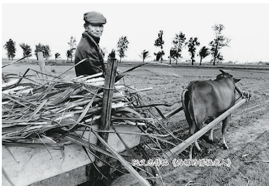
阮义忠作品《西畴的惜福老人》

阮义忠还专门去那种地名奇怪又美丽的地方，比如“美浓”和“多纳”。他1977年拍的一幅美浓乡民的洗衣图，给人世外桃源之感。在阮义忠的眼里，乡土社会是人类的童年，历史在前进，童年在消逝，他则要给台湾的乡土