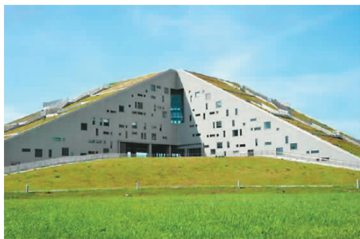
台东大学图书馆信息馆

有作家这样描写这个图书馆：“走进图书馆内，小小的空间，兴奋交织着局促与新奇，电流般将每个人连成一个磁场。在这里，太阳馈赠的能量让自然环境与人文气息水乳交融，令人一见倾心。”