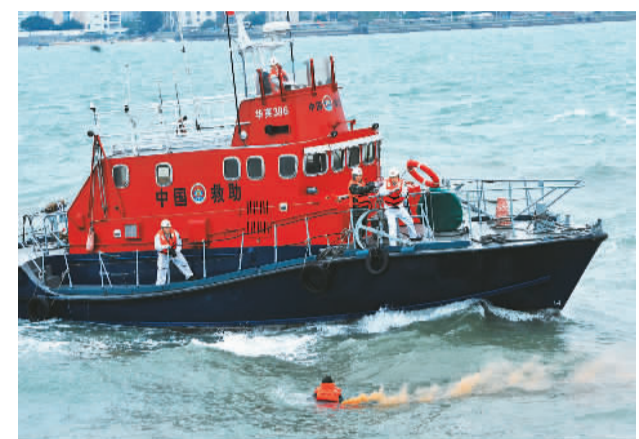
11月23日，“救助系统南部海区应急救援综合演练”在广西北海附近海域举行。本次演练模拟了一艘满载化学纤维的货轮在海上失火后一系列应急响应演练过程。