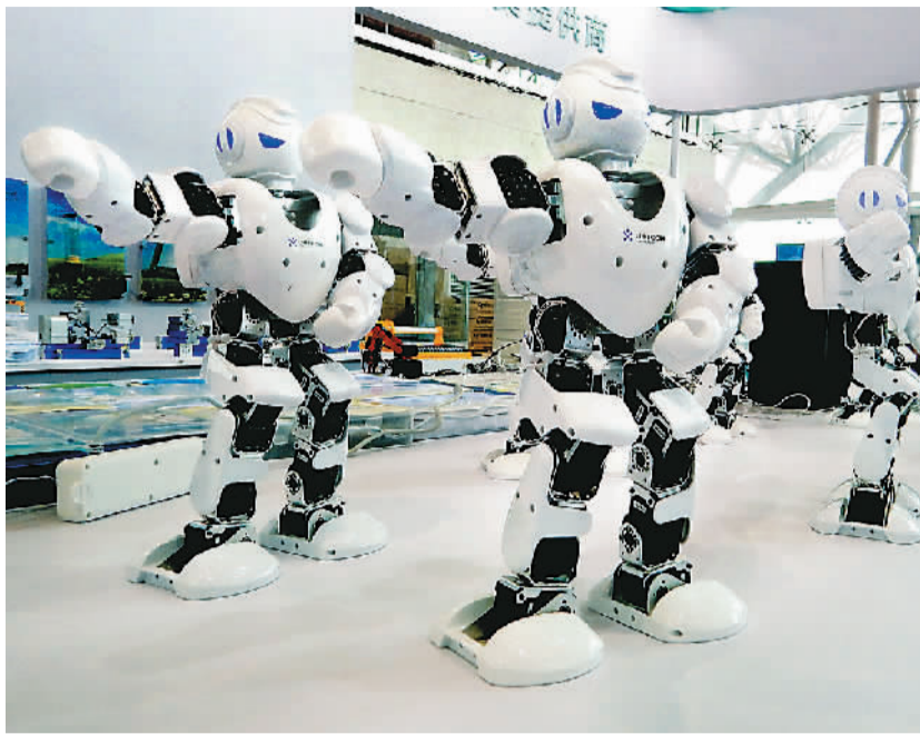
图为9月20日，中国（南京）未来教育与智慧装备展览会上，智能机器人集体亮相。

国家部委和科研机构，召开新一代人工智能发展规划暨重大科技项目启动会，宣布成立新一代人工智能发展规划推进办公室，并公布首批国家新一代人工智能开放创新平台名单。此举标志着，新一代人工智能发展规划和重大科技项目进入全面启动实施阶段。