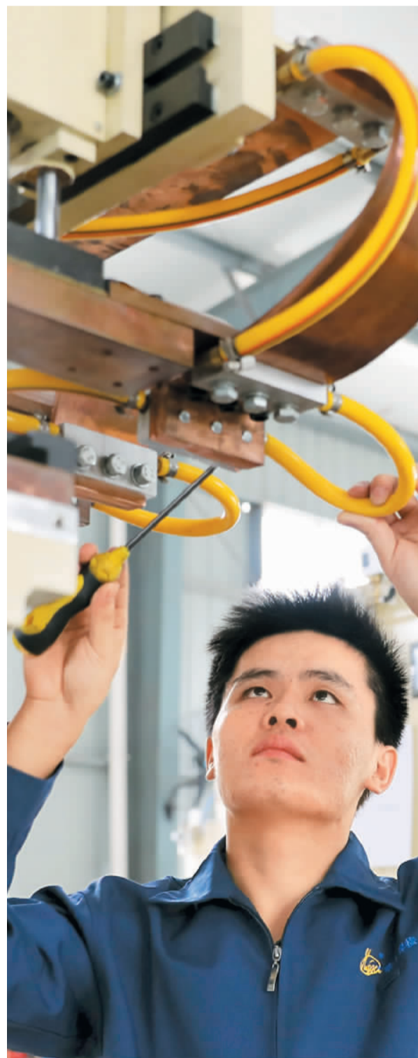
江西高安市加强供给侧结构性改革，引领产业发展。图为位于高安市高新技术产业园的华士科技有限公司工人正在调试出口美国的焊接机器人。

“没有比脚更长的路，没有比人更高的山”，有了全面深化改革的支撑，中国社会主义制度前进的脚步，必将会翻过一山又一山，收获更美的风景。