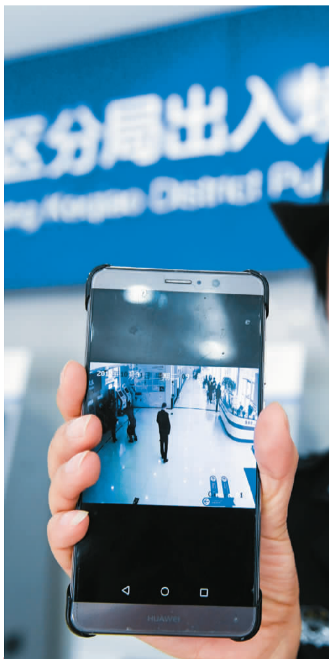
浙江绍兴市柯桥区各个行政部门积极推进行政审批“最多跑一次”改革。图为柯桥区公安分局出入境大厅的民警通过微信的实时“视频大厅”，实时查看办证大厅内的人流量。

可以说，全面深化改革的成果已让人民受益，百姓的生活质量更高了，获得感增强了，人民群众最关心的教育、医疗、社保、就业、环保等领域都有了明显改善。全面深化改革成果也让党自身的发展受益，党的建设制度改革使得党的先进性、纯洁性、战斗性更加强化。全面深化改革成果还让世界受益，“一带一路”倡议、构建人类命运共同体主张惠及全球，促进了全球治理体系变革。