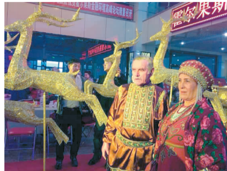
哈萨克斯坦游客在中国霍尔果斯

据悉，新疆霍尔果斯积极创建国家5A级景区中哈国际文化旅游区。霍尔果斯市位于伊犁国际旅游谷谷口，是中国面向中亚、西亚乃至欧洲距离最近、最便捷的边境口岸城市，目前已创建国门景区、可克达拉草原之夜风情园、桃花岛景区及现代科技示范采摘园景区，积极开展中哈边境游。