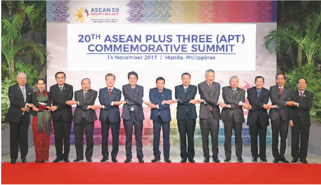
11月14日，国务院总理李克强在菲律宾国际会议中心出席第20次东盟与中日韩（10+3）领导人会议。图为会议开始前，李克强与会领导人合影。

本报马尼拉11月14日电 （记者白阳、张志文）国务院总理李克强当地时间11月14日上午在菲律宾国际会议中心出席第20次东盟与中日韩（10+3）领导人会议，东盟十国领导人以及日本首相安倍晋三、韩国总统文在寅共同出席。菲律宾总统杜特尔特主持会议。