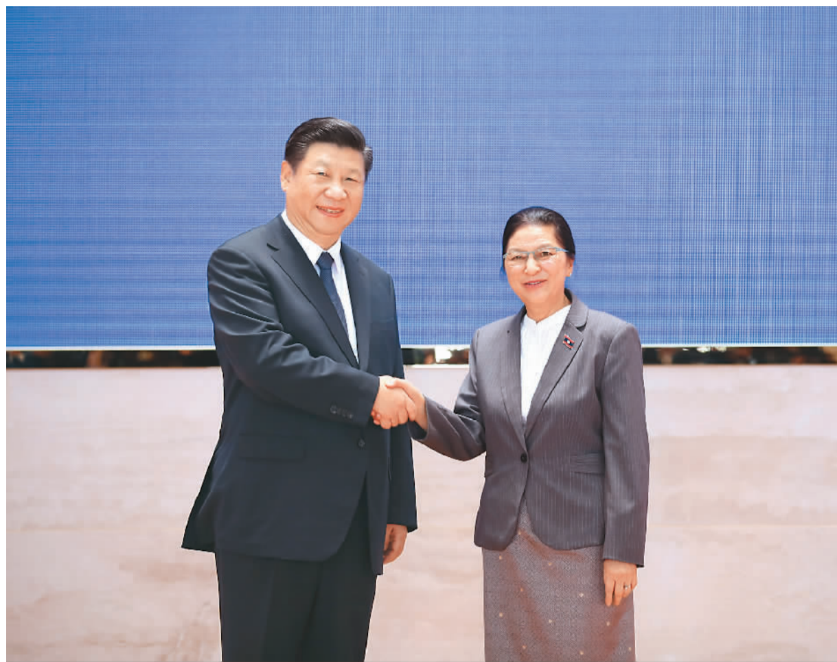
11月14日，中共中央总书记、国家主席习近平在万象国家会议中心会见老挝国会主席巴妮。

丁薛祥、刘鹤、杨洁篪等中方陪同人员，老挝党中央政治局委员、副总理宋赛，副总理兼财政部部长宋迪等参加会见。