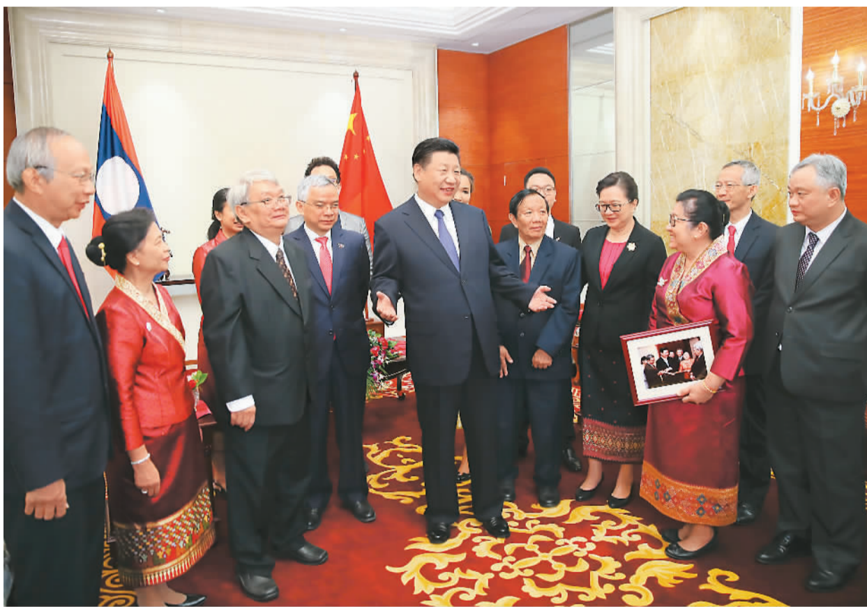
11月14日，中共中央总书记、国家主席习近平在万象下榻饭店会见老挝奔舍那家族友人。

本报万象11月14日电（记者杜尚泽、孙广勇、杨讴）中共中央总书记、国家主席习近平14日在万象下榻饭店会见老挝奔舍那家族友人。