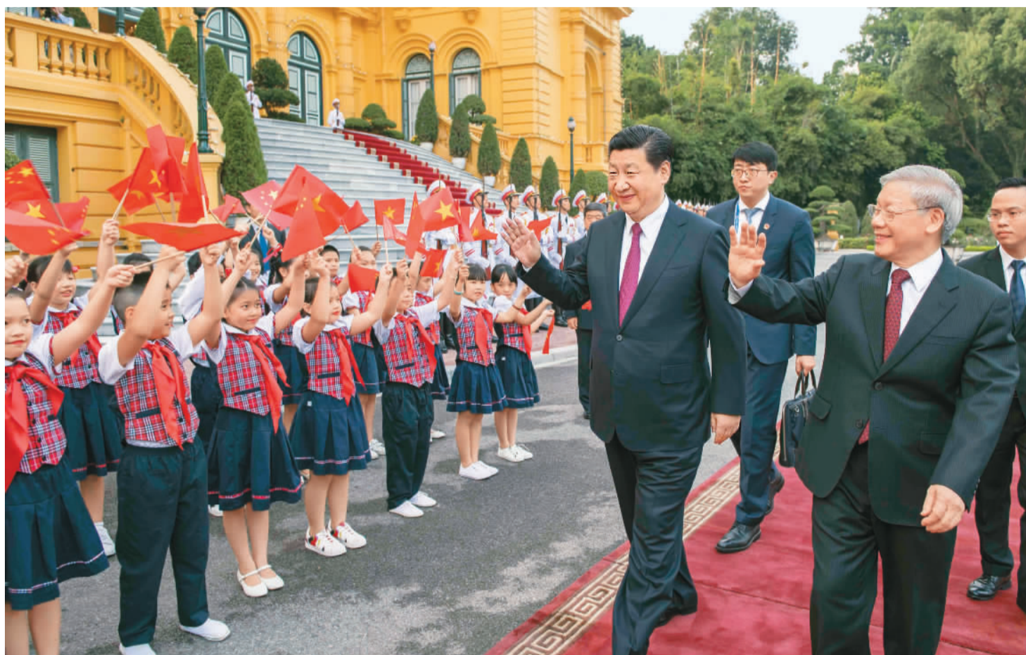
11月12日, 中共中央总书记、国家主席习近平在河内越共中央驻地同越共中央总书记阮富仲举行会谈。图为会谈前, 阮富仲在主席府广场为习近平举行盛大欢迎仪式。