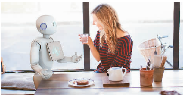
图为可与人类沟通交流的家居机器人。

如今，科技发展构建了智能家庭的全景蓝图，越来越多的智能家居机器人进入到我们的生活。人工智能正在改变我们的生活方式。家里要迎来机器人朋友。面对一种前所未有的新鲜感和参与感，你准备好了吗？