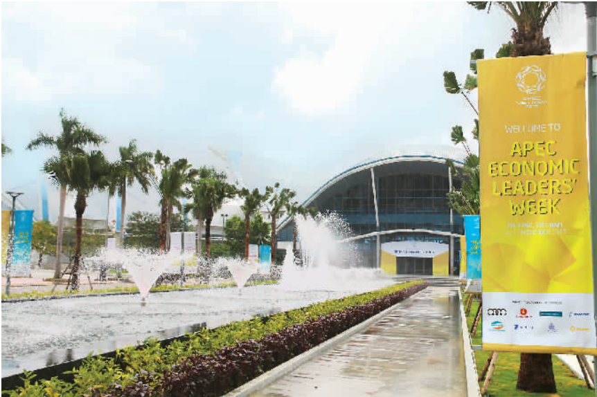
图为越南岘港APEC新闻中心外景。

另外，11月12日至14日，习近平主席还将对越南、老挝进行国事访问。这是中共十九大闭幕后，中国党和国家最高领导人首次出访，将开启新时代中国特色周边外交的新境界。