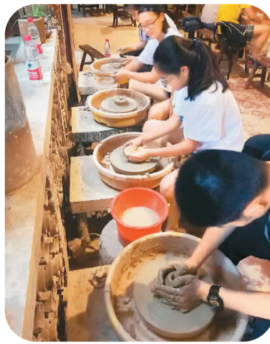
创客在铜官窑创作陶瓷作品。

长沙铜官窑的流传面之广，外销量之大，在中国陶瓷史和“海上陶瓷之路”上都具有重要的地位。1998年，德国一家打捞公司在印度尼西亚勿里洞岛附近的爪哇海域发现的一艘名为“黑石号”的唐代沉船。这艘阿拉伯商船装载着经由东南亚运往西亚、北非的中国货物，仅中国瓷器就达6.7万多件，其中5.6