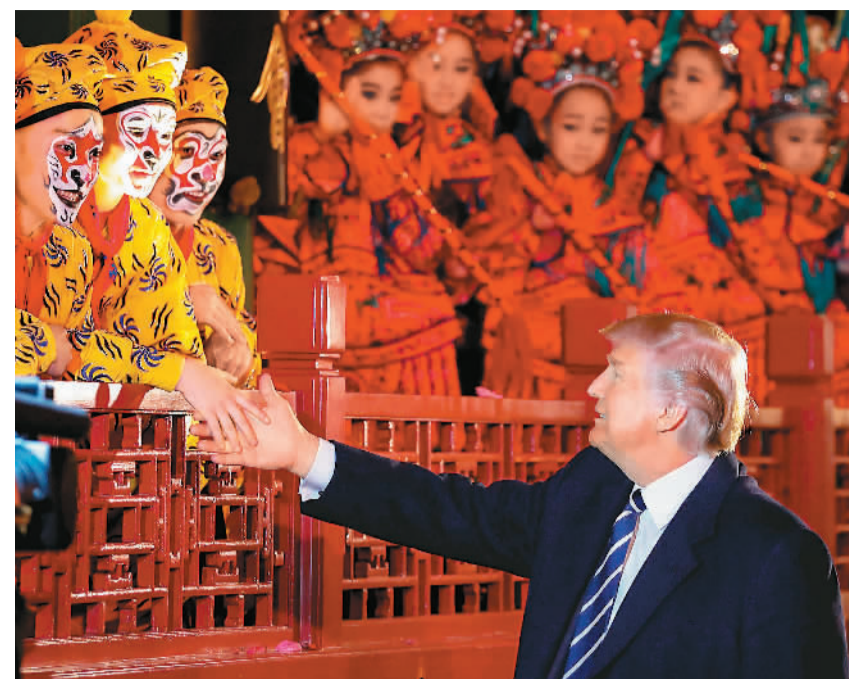
11月8日，美国总统特朗普访华期间在故宫欣赏京剧表演后与演员握手。

从2008年开放中国公民赴美旅游至今，中国游客赴美旅游的出游人数持续增加，出游方式丰富多样，出游品质不断提高。美国目前位居中国游客出境目的地第五位，是长线目的地首位。美国已成为中国游客出境游的常规热门目的地。据美国商务部旅行与旅游业办公室的统计，去年中国游客赴美人数