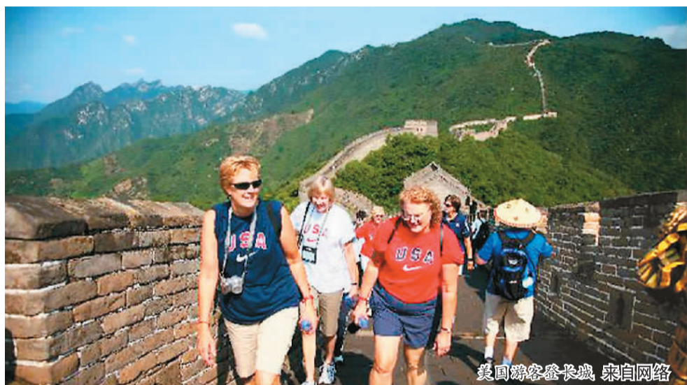
美国游客登长城。

对于中美旅游合作的前景，李金早日前表示，着眼未来，双方应共同推动旅游业可持续发展，积极发挥旅游创造就业、减少贫困、改善民生的经济社会功能；着力加强旅游目的地推广合作，实现优势互补、市场共拓、客源互送，共同提升两国旅游目的地的影响力与吸引力；深化旅游交流合作机制，构建常态化旅游市场联合监管和沟通协调机制，共同维护健康有序的出入境旅游环境。