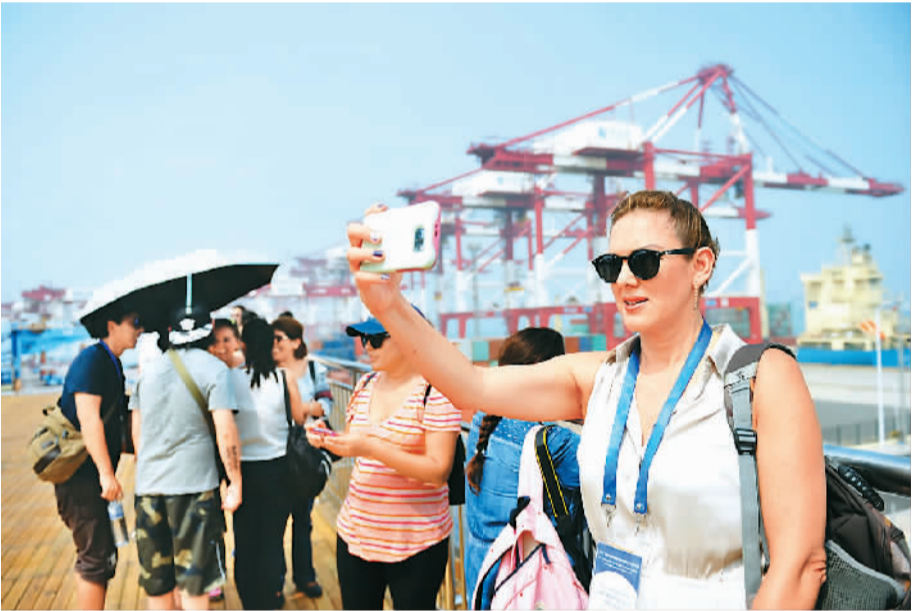
一位外国记者在青岛港参观采访。

未来5年，青岛每年至少开通一条地铁，构建包含市区轨道交通、轨道交通快线、市域范围铁路网三个层次的轨道交通发展体系，形成以胶州湾东岸、西岸、北岸城区为核心，“三城三湾，网间互联”为基本形态，城区之间45分钟可达的中心湾区轨道交通网络。