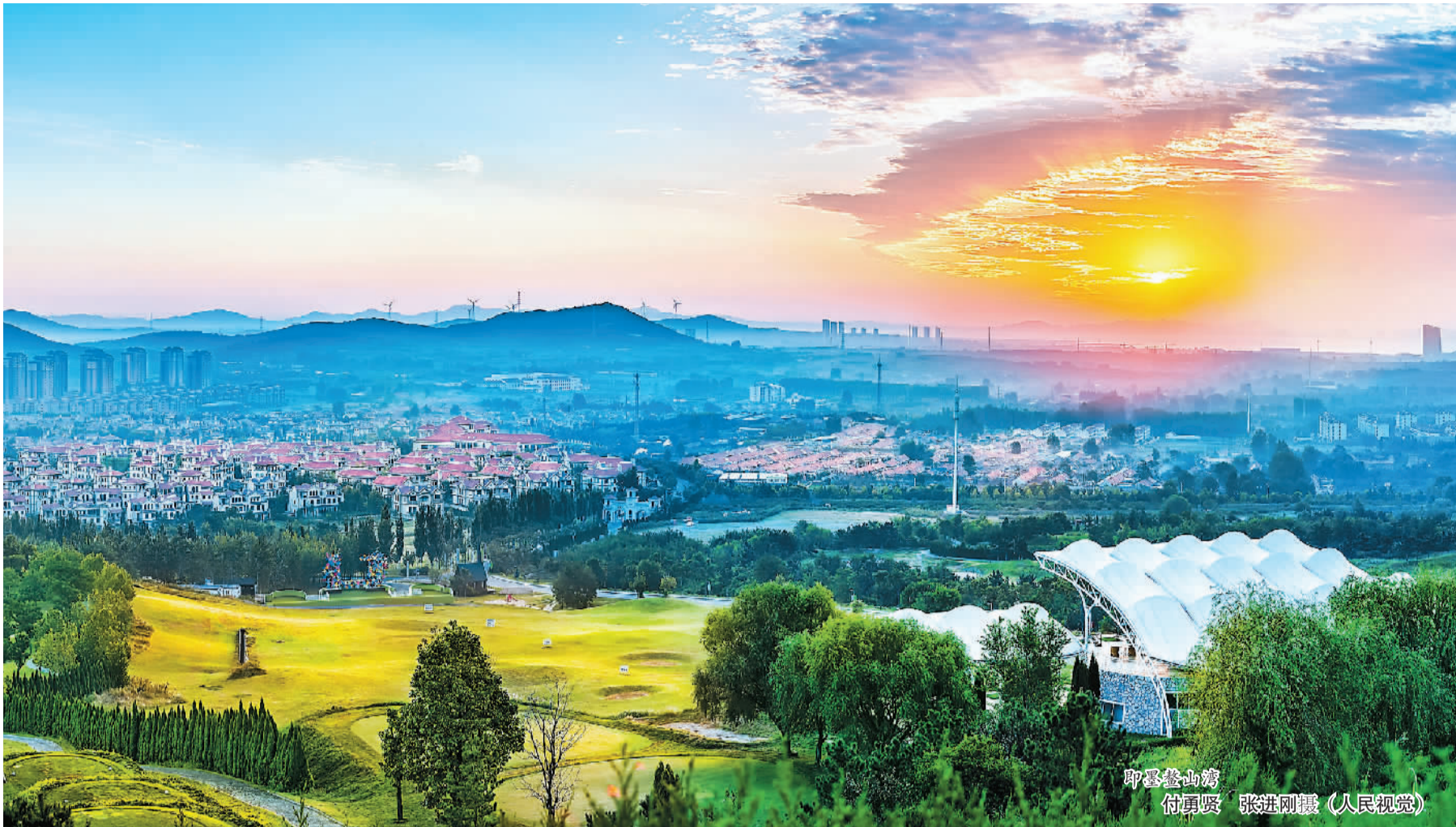
即墨鳌山湾 付勇贤 张进刚摄（人民视觉）