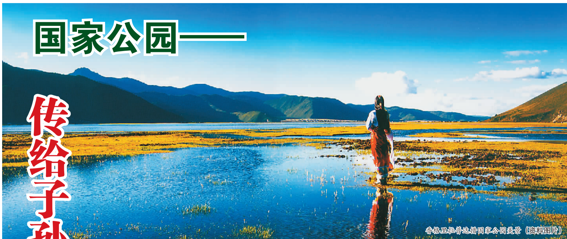
香格里拉普达措国家公园美景 (资料图片)