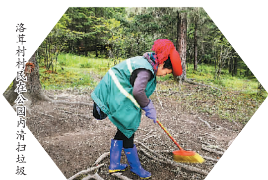
洛茸村民在国家公园内清扫垃圾