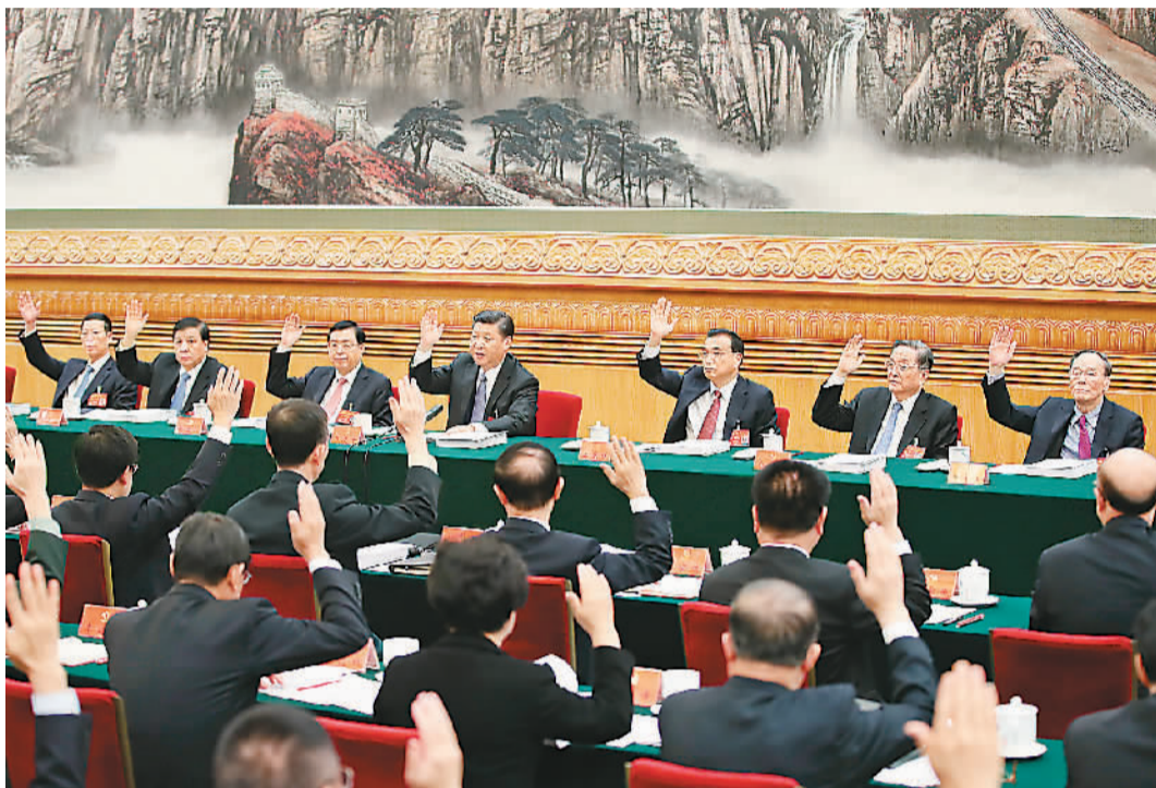
习近平、李克强、张德江、俞正声、刘云山、王岐山、张高丽等出席会议。