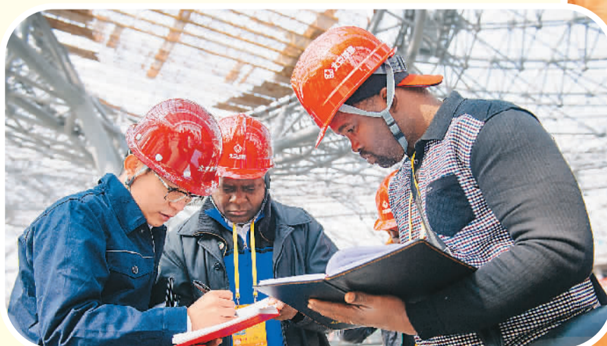
10月16日，外国记者在北京新机场建设工地采访。