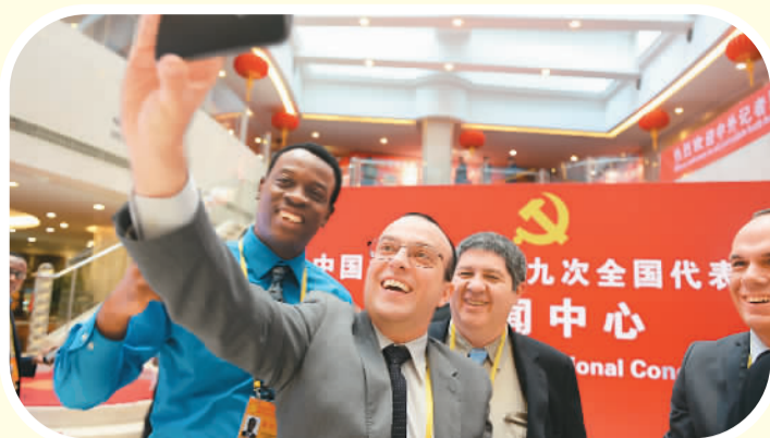
10月16日，外国记者在十九大新闻中心拍照留影。