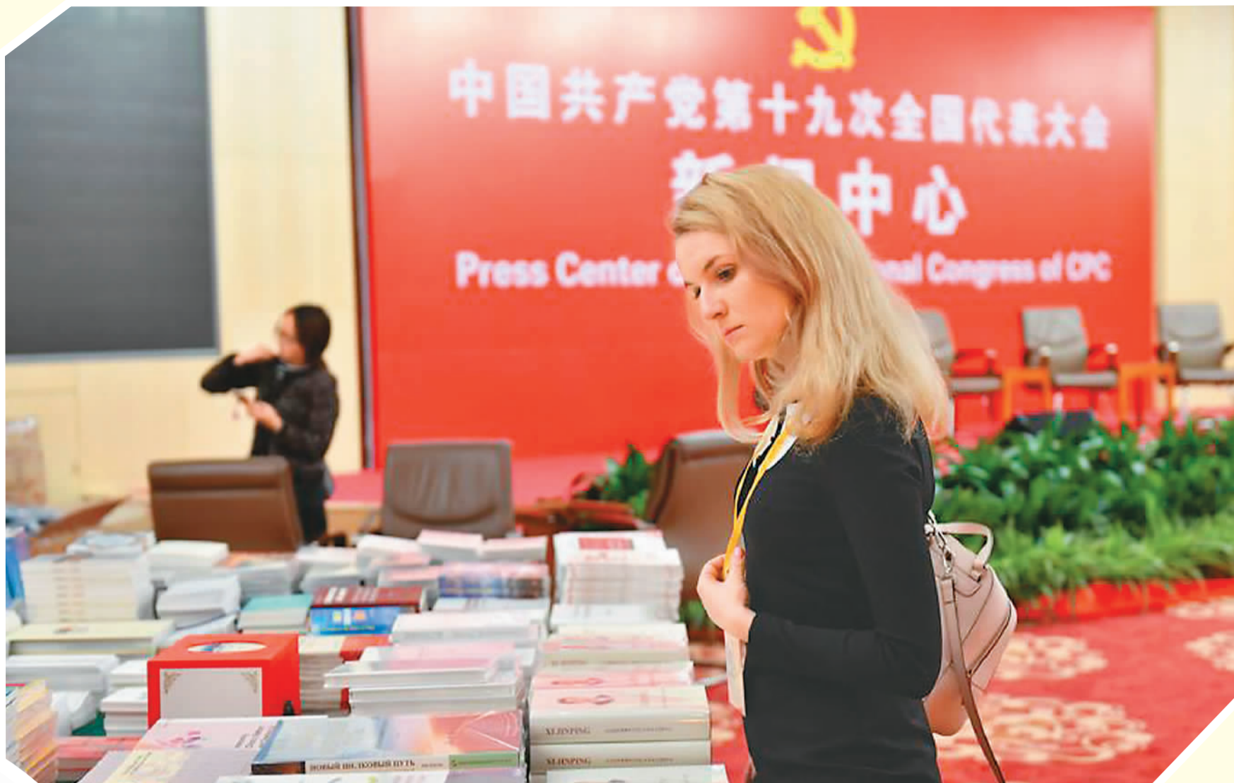
图为在十九大新闻中心，书刊赠阅台吸引了记者驻足观看。