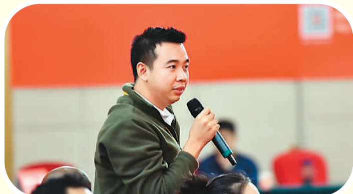
10月19日，在“推进全面依法治国”集体采访上，柬埔寨国家电视台记者提问。