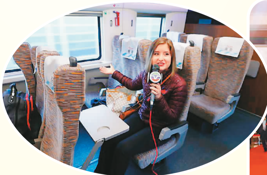
10月17日，美国中文电视台记者在京津城际高铁上采访。

系列采访活动，现场观察中共十九大开幕，在“党代表通道”与采访对象面对面交流……这些都让外媒记者感受到一个发展、开放、和谐的中国，也让世界对中国充满信心。