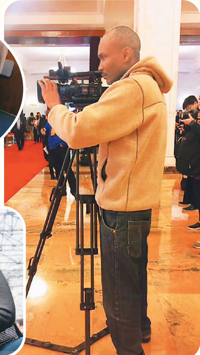
10月18日，十九大开幕会场外，外国记者为采访忙碌着。