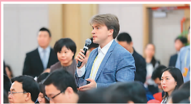
10月19日，中国共产党第十九次全国代表大会新闻中心举行记者招待会，图为外国记者在提问。