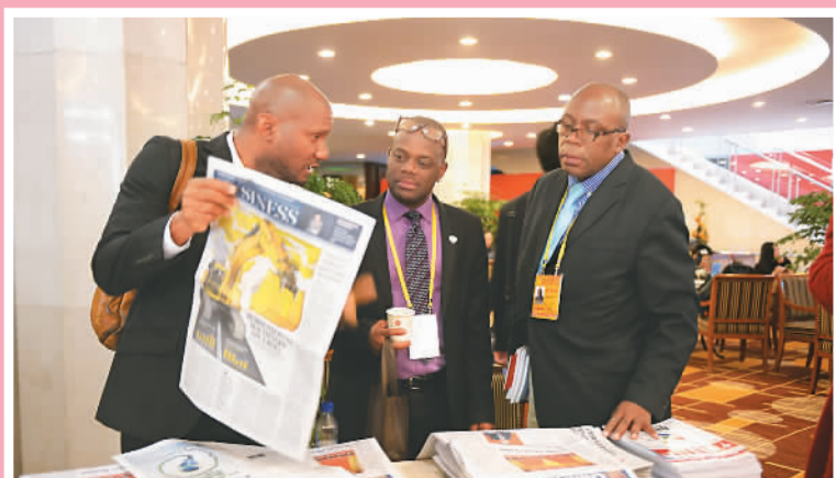
10月16日，外国记者在十九大新闻中心。