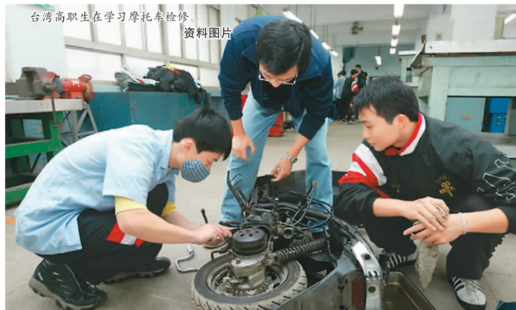
台湾高职生在学习摩托车检修。

近几年，台当局推动技职再造计划，鼓励学生多元化发展，许多人看见高职毕业后有不错出路，于是选择弃高中读高职，期待通过掌握一技之长“安身立命”，或受“工匠精神”熏陶，对特定技艺产生兴趣而不断钻研。同时，对于不少企业主来说，因为拥有专业技能、肯吃苦，高职生群体成为他们选择职工的重要对象。