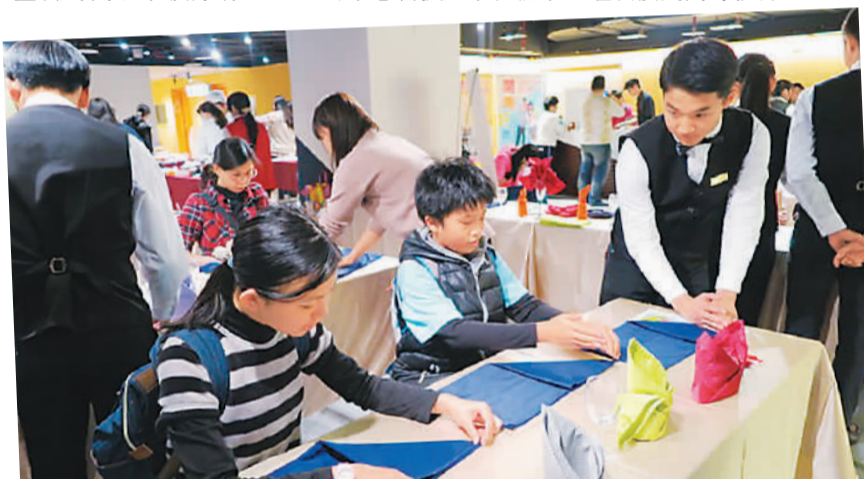
在今年由台北市举办的技职群科体验活动中，升南高工学生教青少年新观念。