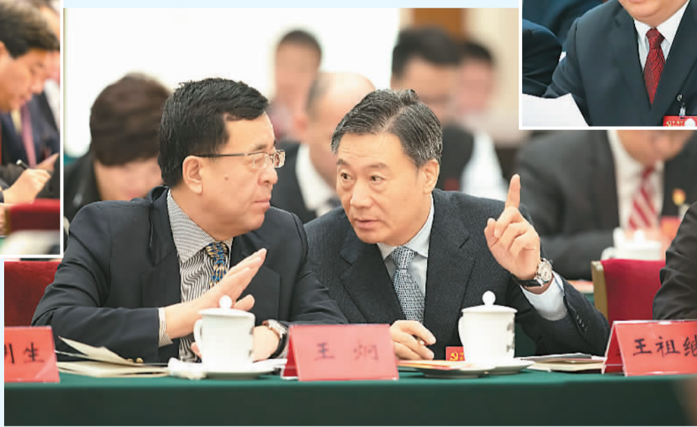
讨论。 ▲十月十九日,河北代表团在讨论。

这几天,中共十九大代表们在参加所在团讨论十九大报告时纷纷敞开心扉、积极发言。会场内,没有了鲜花、绿植,只摆放普通办公用品,使会议更加简洁高效。