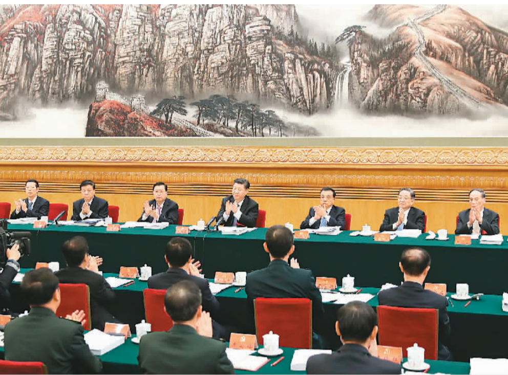
习近平、李克强、张德江、俞正声、刘云山、王岐山、张高丽等出席会议。