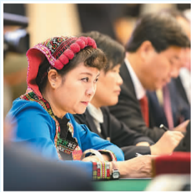
▲10月20日,江西代表团分组讨论。 ▶10月19日,中央金融系统代表团在讨论。

这几天,中共十九大代表们在参加所在团讨论十九大报告时纷纷敞开心扉、积极发言。会场内,没有了鲜花、绿植,只摆放普通办公用品,使会议更加简洁高效。