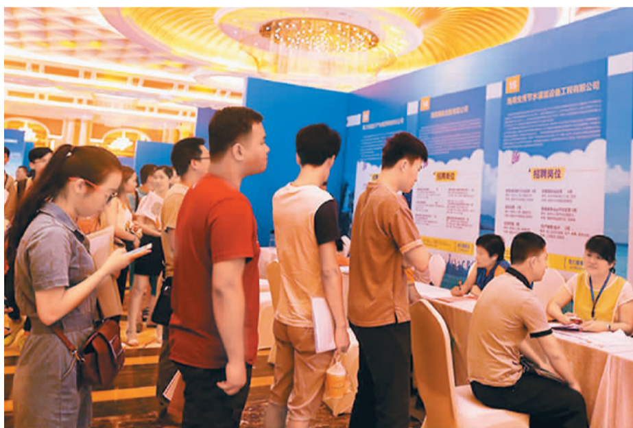
2017海南综合招才引智专场人才招聘会现场。

相较于做一名成功的企业家，安捷罗似乎更加热衷于技术，更享受程序员这个身份。但是，作为一名世界顶级的程序员，安捷罗很快适应了首席执行官的身份。他说：“在Quora的第一年，我的工作基本上就是编程，之后因为有太多的事务需要我来处理，我只能偶尔写点代码。而且每当我写程序的时候，我会感觉自己特别自私，因为还有很多人在等着我做决定。”