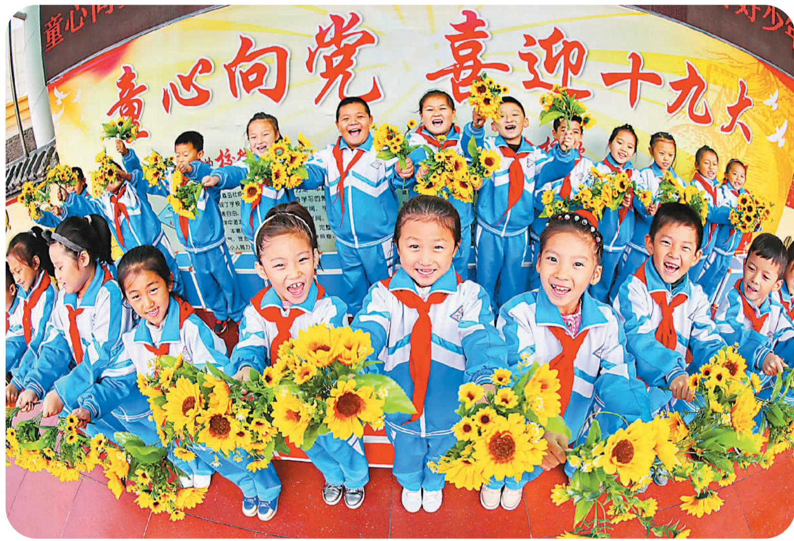
近日,河北省秦皇岛市海港区先盛里小学开展“童心向党 喜迎十九大”主题活动。孩子们通过演唱红色歌曲、学习党史知识、