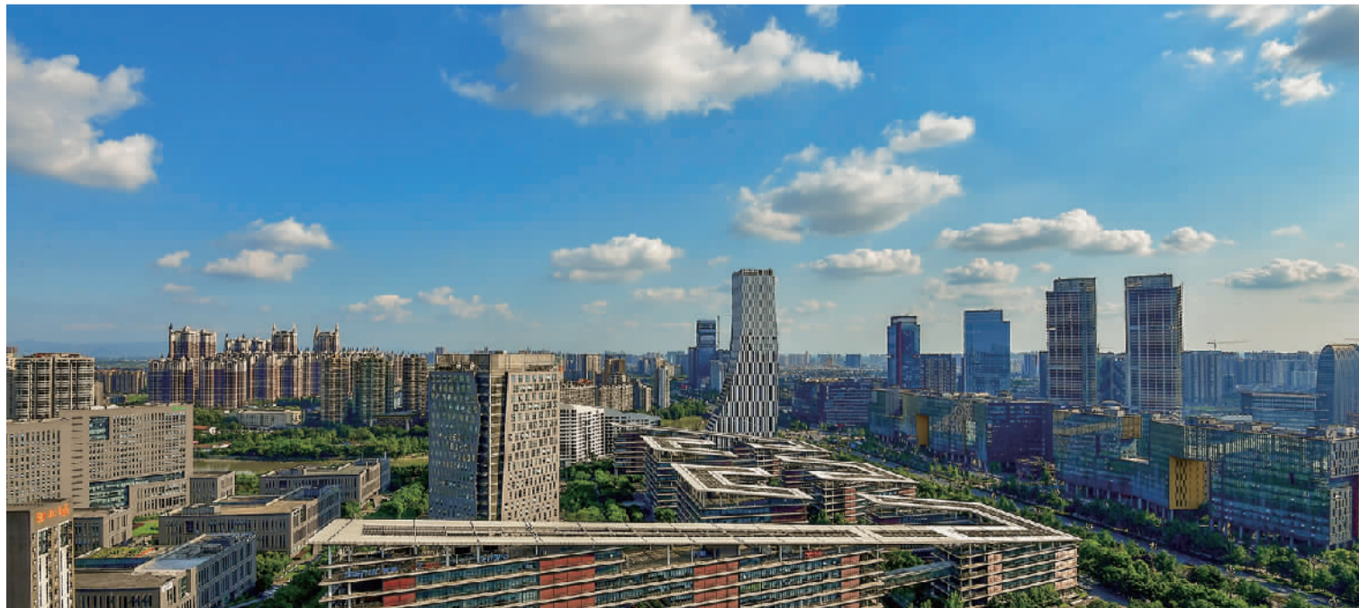
成都高新区南部园区

成都高新区相关负责人表示，成都高新区将紧扣“东进、南拓、西控、北改、中优”城市空间布局，奋力打造国际创新创业中心、现代化产业基地核心区，奋力成为西部经济中心的主支撑、西部科技中心的主引擎、西部金融中心的主阵地、西部文创中心的主品牌、西部对外交往中心的主窗口，全力助推成都建设全面体现新发展理念的国家中心城市。