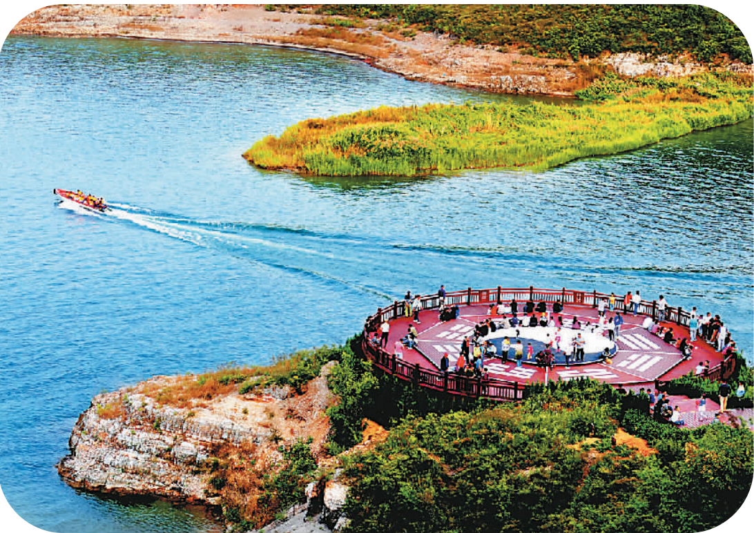
下图为易水湖休闲小岛