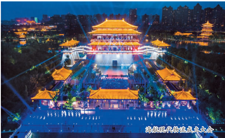
海航现代物流成立大会

在此基础上,充分发挥客流、物流聚集效应,布局旅游、酒店等关联业态,8月21日,海航现代物流旗下长安航旅与延安市人民政府签署战略合作协议,未来将在航空、旅游、物流、金融等领域开展全方位、多层次的合作,积极参与景区、特色小镇、酒店、文化传媒等产业的建设,实现“航空+旅游+金融+互联网”航旅模式在陕西各地的复制推广。