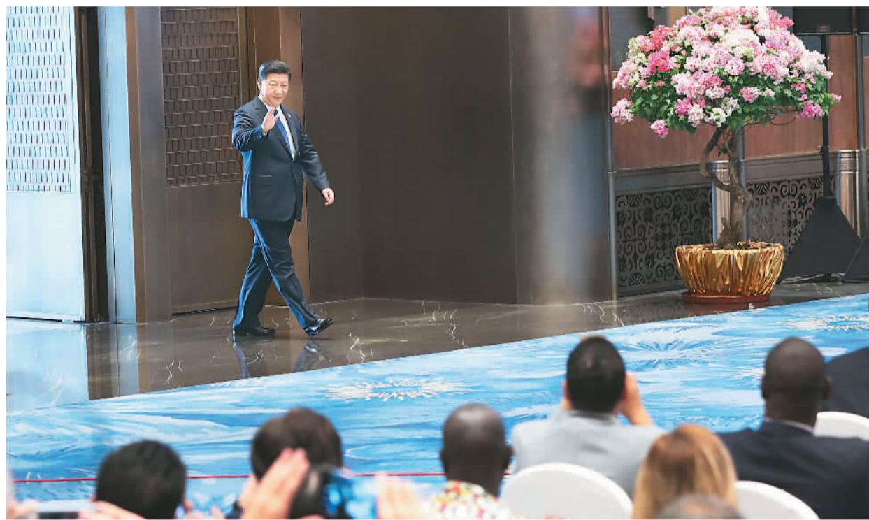
9月5日，国家主席习近平在厦门国际会议中心会见中外记者，介绍金砖国家领导人第九次会晤和新兴市场国家与发展中国家对话会情况。

习近平指出，昨天，金砖国家领导人厦门会晤圆满闭幕。会晤通过了《金砖国家领导人厦门宣言》，重申开放包容、合作共赢的金砖精神，全面总结了金砖合作10年来的成功经验，为加强金砖伙伴关系、深化各领域务实合作规划了新蓝图。五国领导人认为，金砖国家应该深化在重大问题上的沟通和协调，捍卫国际关系基本准则，合作应对各种全球性挑战，加快全球经济治理改革；加强宏观政策协调，对接发展战略；深化政治安全合作，增进战略互信；将人文交流活动经常化、机制化，加深五国人民相互了解和友谊；与时俱进加强金砖机制建设，为各领域合作走深走实提供坚实保障。各国领导人决心以厦门会晤为新起点，共同打造更紧密、更广泛、更全面的战略伙伴关系。