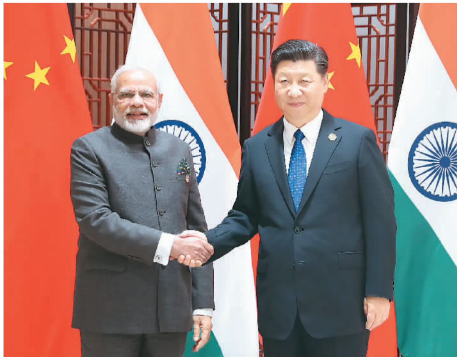
9月5日，国家主席习近平在厦门会见来华出席金砖国家领导人第九次会晤和新兴市场国家与发展中国家对话会的印度总理莫迪。

本报厦门9月5日电（记者杜尚泽、邹志鹏）国家主席习近平5日在厦门会见来华出席金砖国家领导人第九次会晤和新兴市场国家与发展中国家对话会的印度总理莫迪。