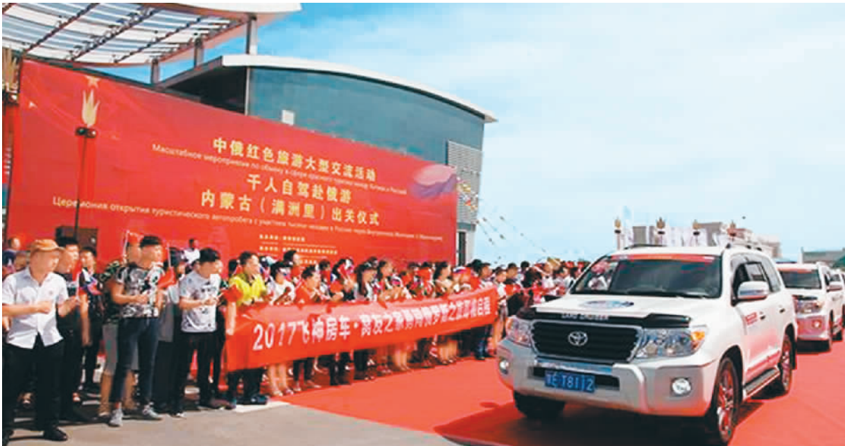
2017中俄红色旅游交流活动千人自驾赴俄游出发仪式。

目前，旅游交流合作已经成为中俄双边务实合作的重要组成部分。据统计，去年中国访俄游客数量达到107.3万人次，同比上年增长15%；俄罗斯访华游客达到118.3万人次，同比上年增长31%。去年，中国是俄罗斯第一大入境客源国，中国也成为俄罗斯游客出境游增长幅度最大目的地之一。据俄罗斯媒体报道，今年上半年中国免签赴俄游客数量与2016年同期相比增长36%。 中俄双边旅游快速发展离不开两国采取的各项有力措施。首先，互办“旅游年”。中俄两国2012年举办了“中国俄罗斯旅游年”，2013年举办俄罗斯“中国旅游年”，这些活动吸引了大量民众的关注，增进了民众之间的相互了解和传统友谊，拉动了旅游产业的互动、交流和合作。 其次，两国采取签证便利化措施。2000年中俄双方签署了团队旅游互免签证协议。简化了手续，节约了时间，获得了游客的肯定，吸引更多游客参加团队游。