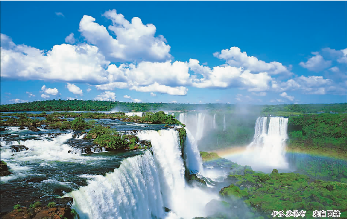
伊瓜苏瀑布

一步吸引整个拉丁美洲的游客前往中国旅游。此外，为进一步促进巴西本地的旅游业发展，今年的2月份，巴西国家旅游公司参加了中国广州国际旅游展览会，巴西国家旅游公司副总裁图费在会上表示，为了吸引更多的中国游客，他们已经在最大的社交媒体网络开设了账号，他希望此举能够让更多中国人了解巴西，吸引中国游客前往巴西旅游。 今年是金砖国家开启合作机制的第二个“金色十年”，不论在经济、文化、旅游还是其他方面，巴西同中国的合作不断推进。通过旅游这座桥梁，金砖国家人民能够更深层次地加深对此的沟通和理解，增进彼此的友谊和合作。