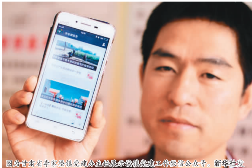
图为甘肃省李家堡镇党建办主任展示该镇党建工作微信公众号。

今年5月，人民网舆情监测室发布《2017年第一季度人民日报·政务指数微博影响力报告》(以下简称《报告》)，引发社会各界广泛关注。据统计，截至2017年6月30日，经过新浪平台认证的政务微博达到171411个，较2016年年底增加6889个。其中政务机构微博132012个，新增6914个，公务人员微博39399个。