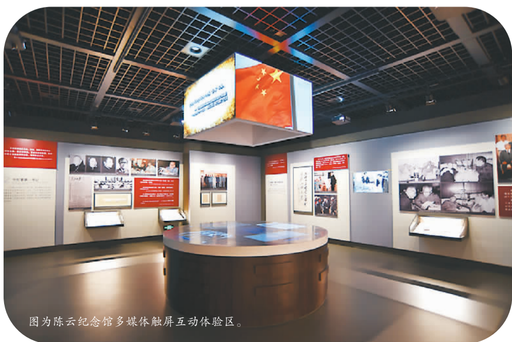
图为陈云纪念馆多媒体触屏互动体验区。

博物馆“上线”不是互联网技术与博物馆的简单相加，而是依托互联网的平台，使博物馆与周边资源实现跨界融合，在融合中探索新的运作模式，实现线上线下无缝连接，提高博物馆的运作效能，为博物馆的发展开辟新渠道。未来虚拟现实(VR)、增强现实(AR)、直播技术等都将一步步与相关产业结合起来，博物馆会因此“活”起来，文博行业也会因此转型升级，开启一个新的生态格局。