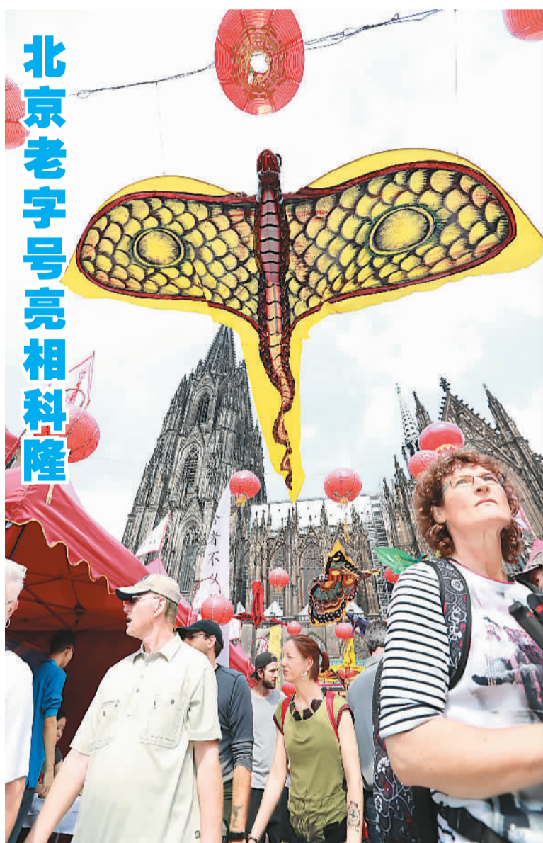
北京老字号亮相科隆