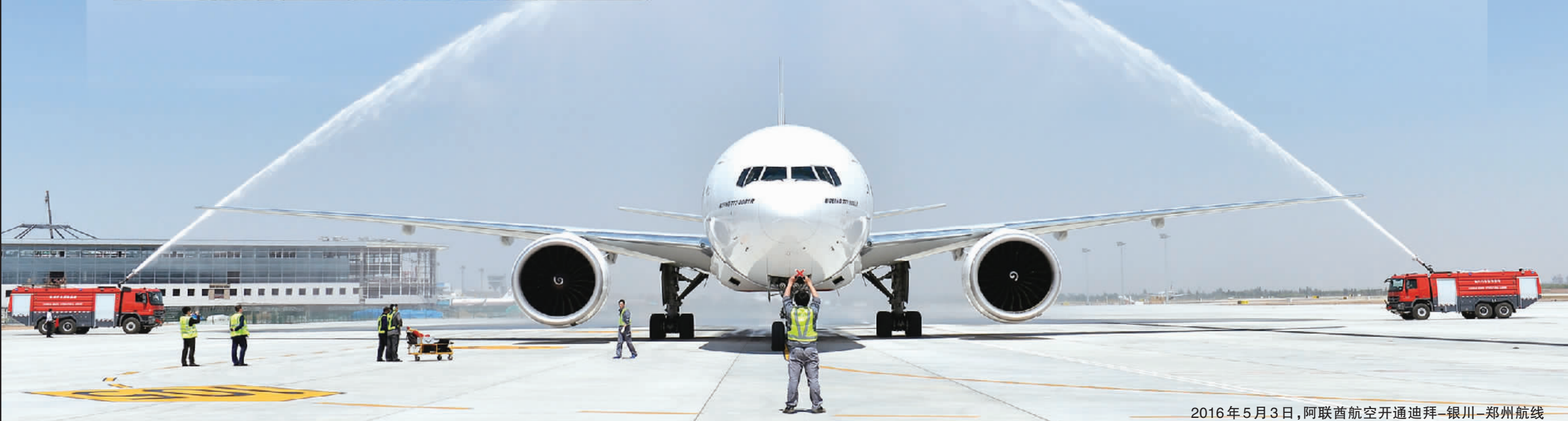
2016年5月3日,阿联酋航空开通迪拜—银川—郑州航线

本届博览会国际综合展参展国别数量创历史新高,目前已确认有来自38个国家和地区的25家政府机构、商协会以组团形式参展,超过50家企业以个体形式参展,参展国别五大洲均有涉及。