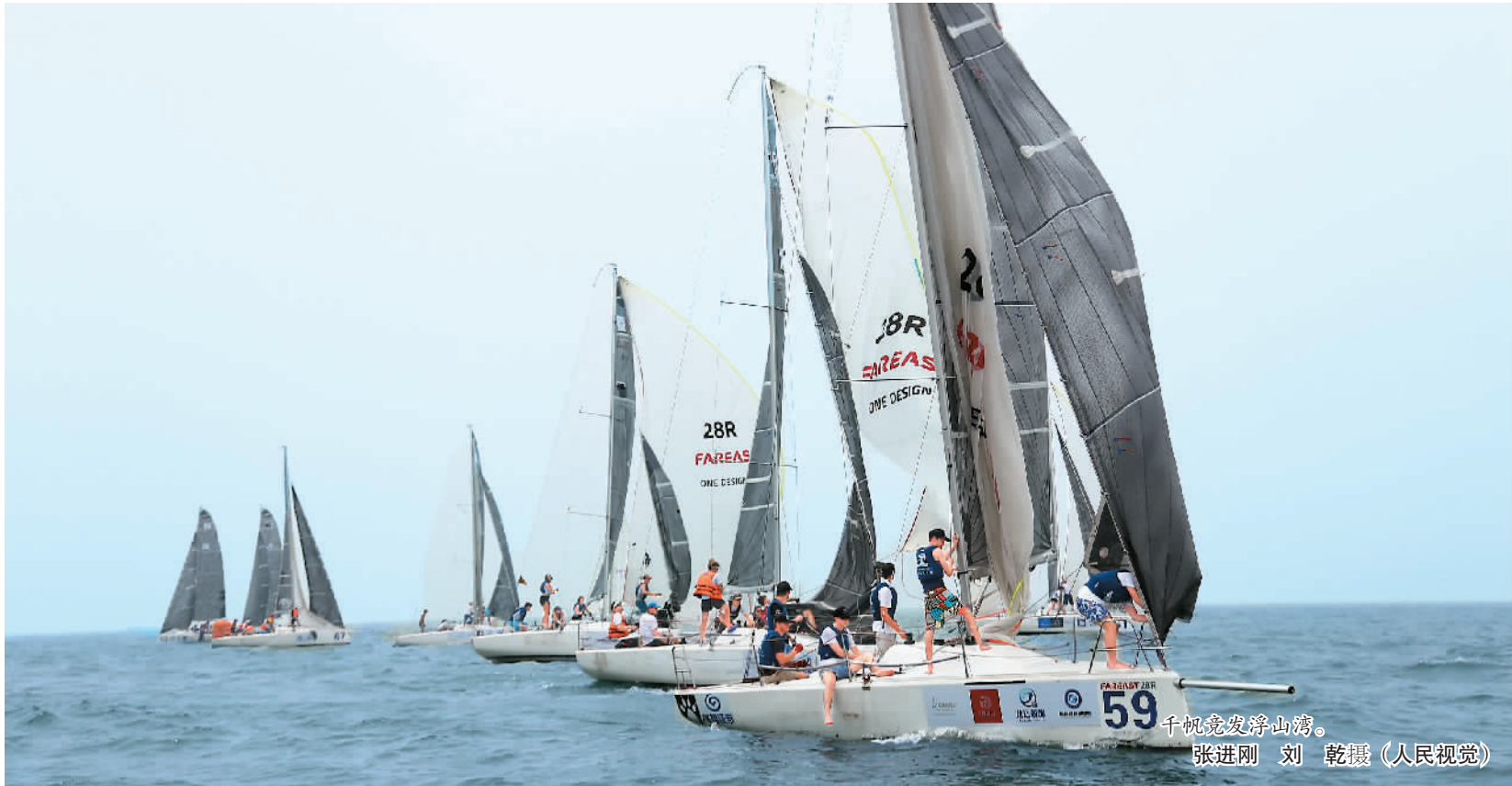
千帆竞发浮山湾。