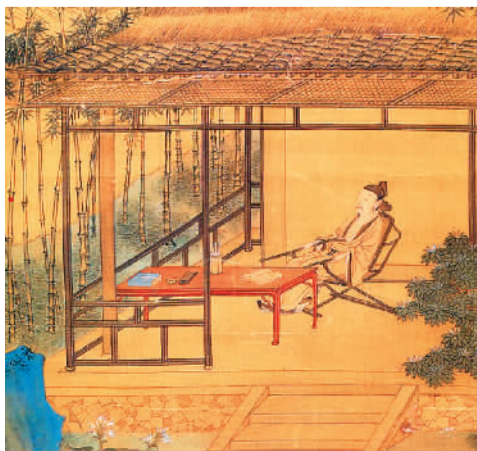
明 仇英《桐阴绘静图》

近日，著名文学评论家、中国作协副主席李敬泽的最新作品集《咏而归》由中信出版社出版。从孔子、庄子等“巨人”开始，李敬泽在书中引领读者重新走进历史上最了不起的可能也是人们最不熟悉的文学时代。