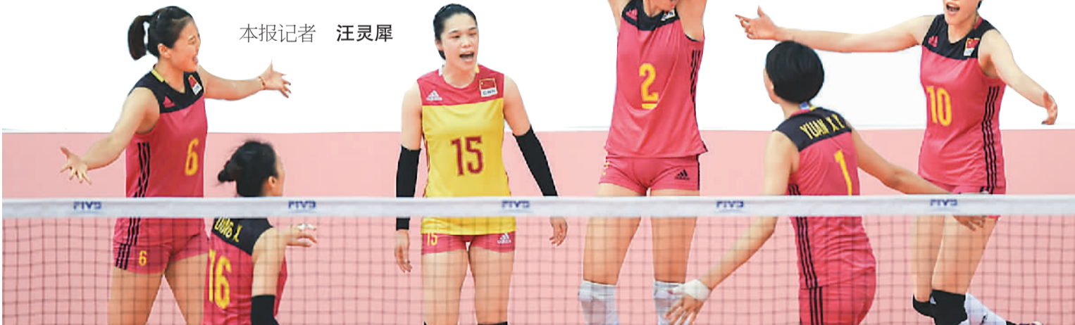
中国队球员在比赛中庆祝得分。