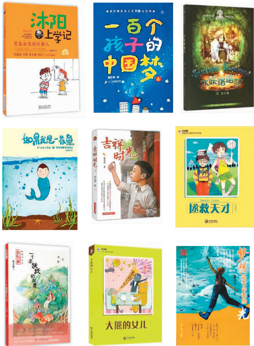
第十届全国优秀儿童文学奖部分获奖书目

对于今天越来越见多识广的童书读者来说，儿童文学要在艺术的创造中持续提供新故事的趣味，日见难度。但迎向这一写作的难度，必然也会有新的视