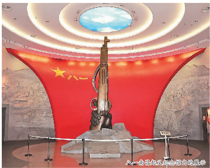
八一南昌起义纪念馆内的展示

“八一”主题的群众性活动是南昌市民文明素质和城市文明程度“双提升”的鲜活载体。近年来，南昌市开展了爱国主义教育入学校、国防教育入学校、红色文化进社区等一系列传承红色基因、弘扬红色文化的爱国主义教育活动，不断地丰富着南昌市民文化的“八一”特质和内涵。从革命遗址的修缮到红色文化的普及，从“八一”品牌的塑造到红色基因的传承、英雄城、拥军模范城的南昌城市品格已然成形，“美丽南昌·幸福家园”的美好画卷正在展开。