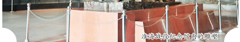
淮海战役纪念馆内的雕塑

作为全国首批爱国主义教育基地和全国红色旅游经典景区，淮海战役纪念馆每年吸引300多万游客参观。优美的自然景观与庄严肃穆的纪念建筑交相辉映、相得益彰，使游客在接受红色文化熏陶的同时感受到诗情画意的绿色景观，实现了用红色文化吸引人，用绿色景观留住人的效果。