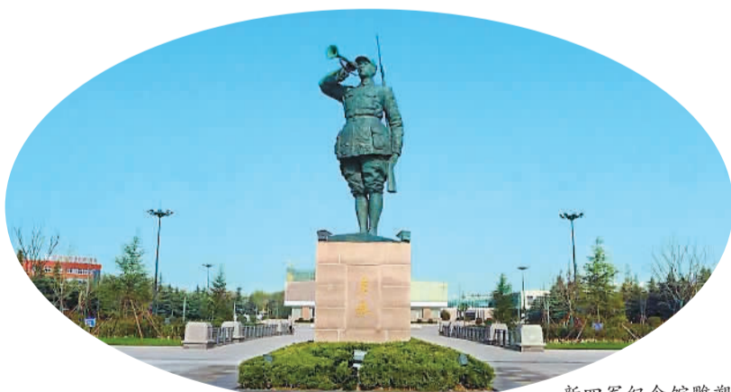
新四军纪念馆雕塑

硝烟散去满园春。七十载虽已逝去，但那些感人至深的抗战故事，依然定格在人们的记忆深处。千百次抗争，风雪饥寒，他们不改本色；千百里转战，穷山野营，他们不移决心。他们的名字叫新四军。历经艰难险阻，千百次浴血奋战，新四军的铁军气魄令敌人闻风丧胆。