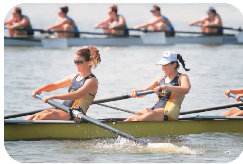
7月22日,2017中国杭州国际名校赛艇挑战赛在西湖白堤水城鸣笛开赛,来自剑桥大学、哈佛大学、清华大学、浙江大学等16所国际知名高校的赛艇选手一决高低。图为女子组选手在西湖白堤水域奋力划行。