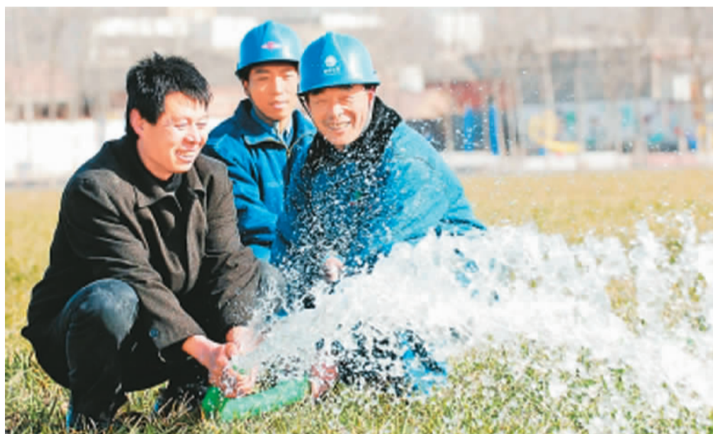
图为河南省许昌县供电公司员工利用通电机井帮助村民浇地。

钢琴家王羽佳的倾情加盟,音乐厅2800多个座位座无虚席。 兼任中华青少年交响乐团首任团长的叶小钢表示,这次巡演将中国年轻艺术家精湛的音乐技能和深厚的艺术