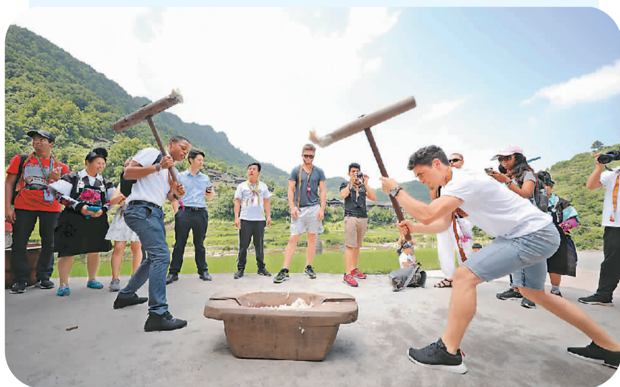
近日,来自德国、南非和贵州财经大学的师生,在贵州省丹寨县南乡清江村开展乡村游学令营活动,各国师生现场体验了苗寨拦门酒、苗族打糍粑等特色民俗活动和扎染、苗族刺绣等非物质文化遗产。