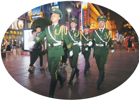
图为十中队官兵在南京路巡逻。

在十中队营房,有一副对联分外醒目:听党指挥意志坚,艰苦奋斗永不忘;身居闹市不染尘,甘当人民勤