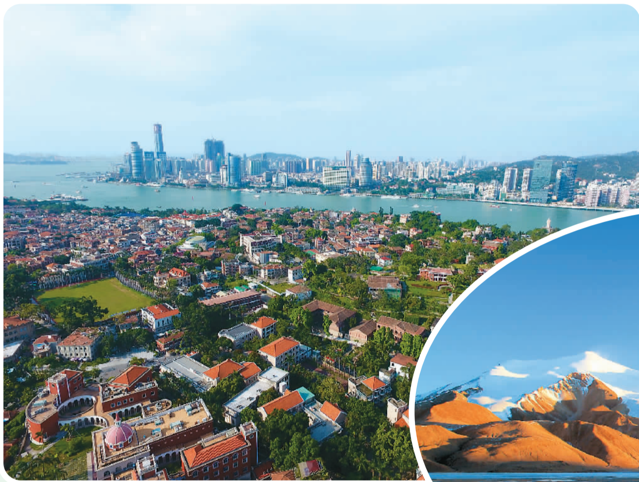
上图：鼓浪屿上的传统建筑群。 右图：可可西里的雪山和河流。