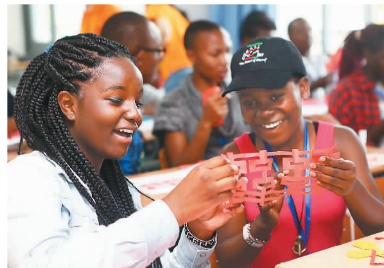
6月23日，在中华文化体验夏令营上，内罗毕大学孔子学院的学生展示剪纸作品。

“我们应该以张开双臂拥抱世界的积极态度，大力拓展各种形式夏令营，丰富内容、展现魅力、传播经典、体现关怀，扩大知华、友华的‘朋友圈’。”高玉葆对笔者说。