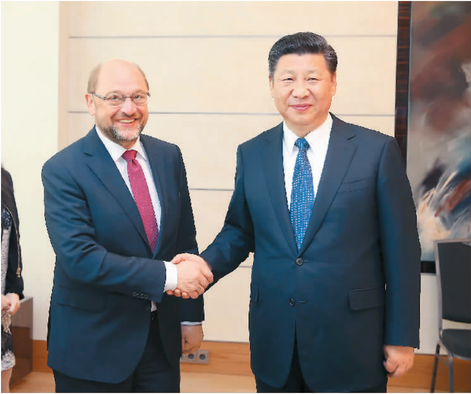
7月6日，国家主席习近平在柏林会见德国社会民主党主席舒尔茨。