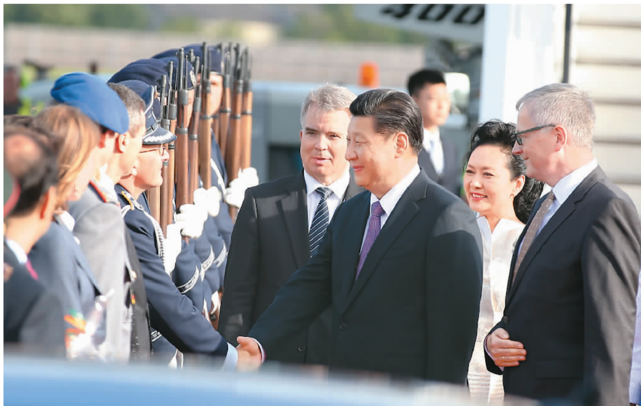
七月四日, 国家主席习近平乘专机抵达柏林, 开始对德意志联邦共和国进行国事访问。德国政府高级官员在舷梯旁迎接习近平和夫人彭丽媛。