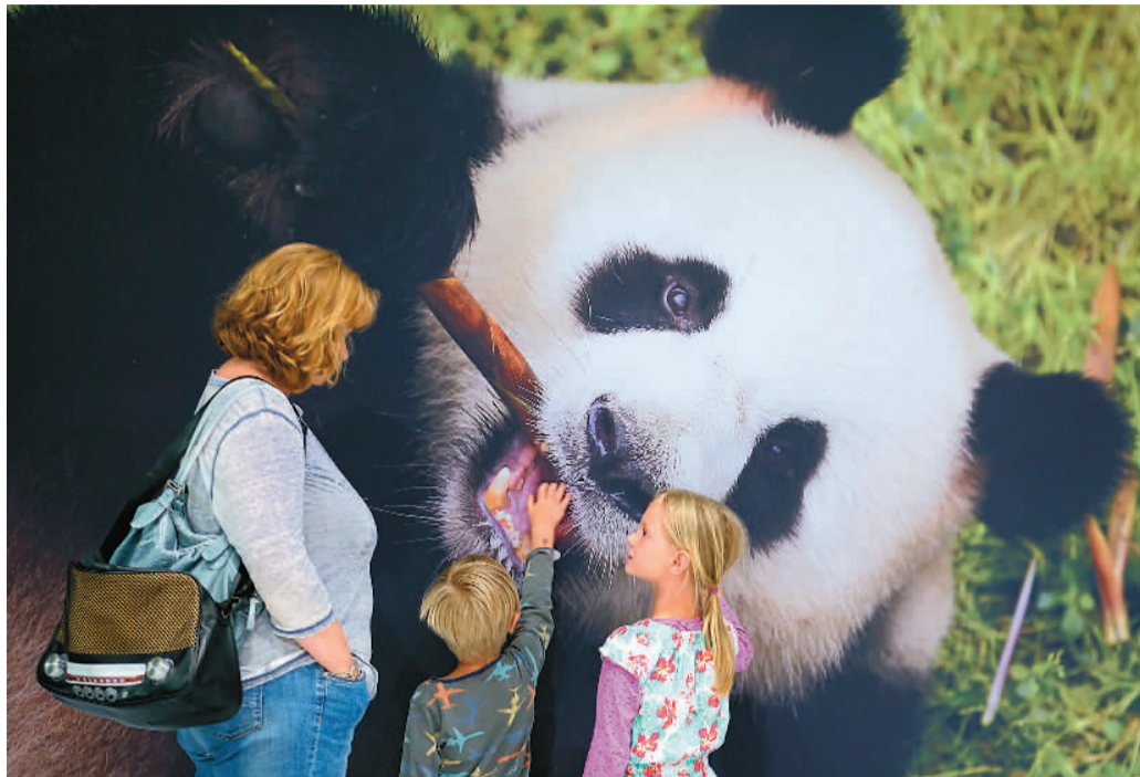
图为当地时间6月24日,德国柏林,在舍讷费尔德机场欢迎大厅内,前来欢迎大熊猫“梦梦”“娇庆”的德国儿童抚摸“娇庆”的照片。

不久前,两只大熊猫“梦梦”与“娇庆”抵达柏林,受到德国民众的热烈欢迎。据悉,访问期间,习近平将同德