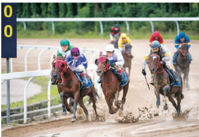
7月1日，2017武汉速度赛马公开赛“同庆香港回归20周年”主题赛在湖北武汉举行。