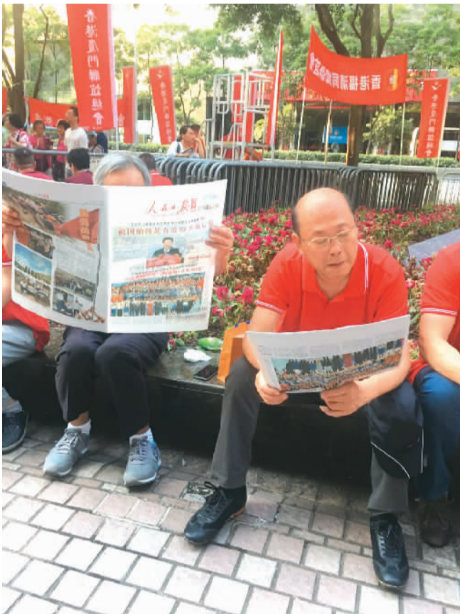
7月1日，香港市民正在阅读当天的《人民日报海外版》。