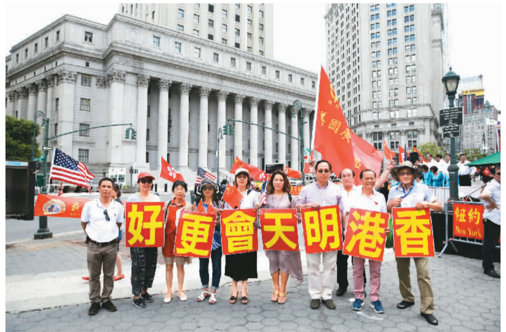
当地时间6月25日，美东各界华侨华人庆祝香港回归20周年大会在纽约曼哈顿弗利广场举行。图为参会华侨华人打出“香港明天会更好”标语。