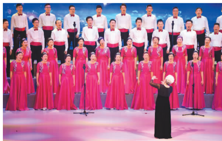
6月29日晚，“紫荆绽放二十载——香港各界庆祝香港回归祖国二十周年合唱大汇演”在红磡香港体育馆举行。图为表演团体进行合唱。