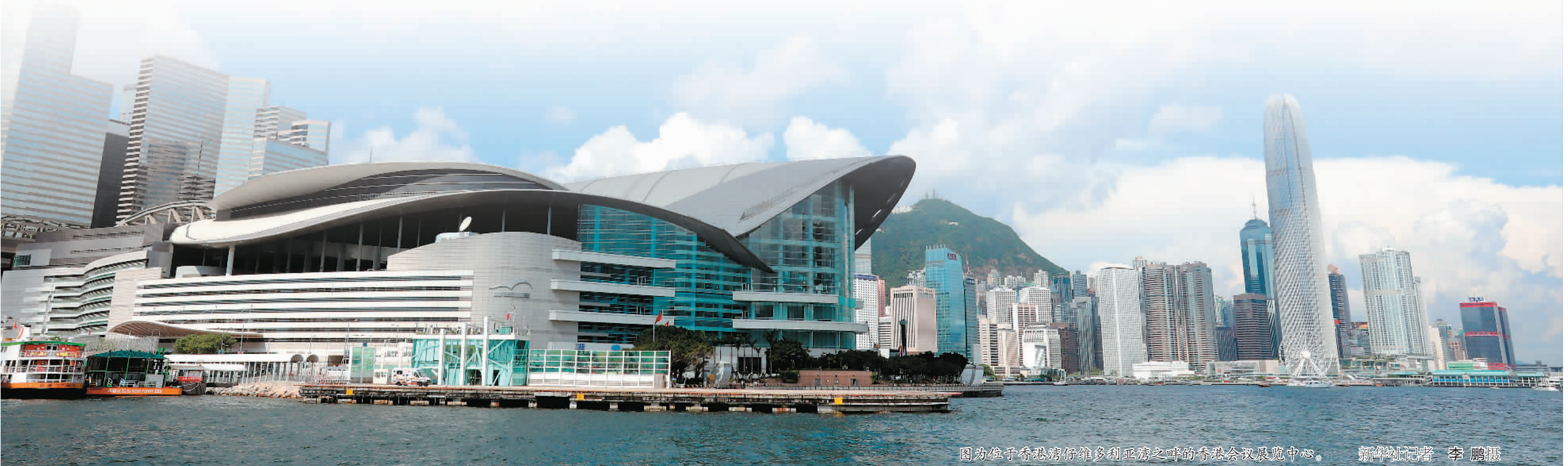
图为位于香港湾仔维多利亚湾畔的香港会议展览中心。