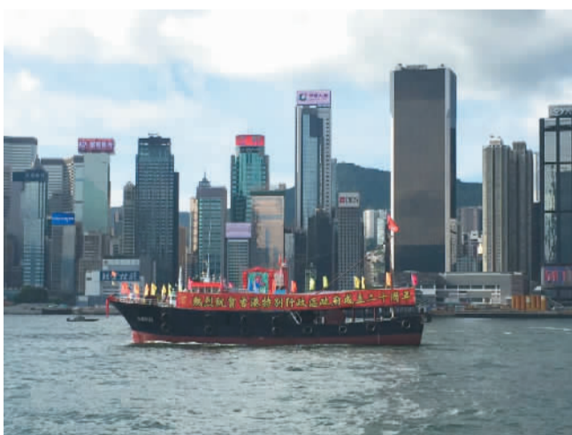
7月1日，香港渔民团体联会和香港各界庆典委员会组织100艘渔船在香港维多利亚湾巡游，庆祝香港回归祖国20周年。