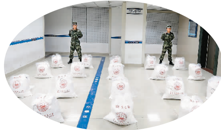
图为支队官兵在看守收缴的毒品。

据介绍，今年初，该支队侦查员发现多名社会闲散人员肆意大量走私贩卖毒品。专案组历时3个多月，于今年四五月，在多地同时收网，连破两起超过500公斤特大贩毒案。